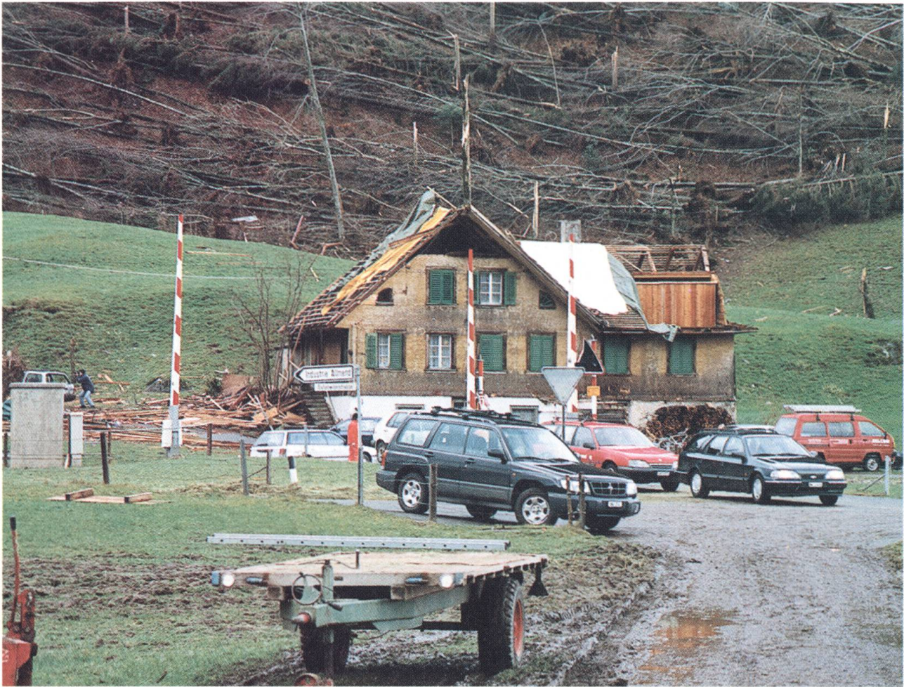
Allmendstall in Oberdorf wurde vom Sturmwind buchstäblich zermalmt.

im Rahmen ihres Wiederholungskurses für diesen Nothilfeinsatz aufgeboten. Die eingesetzten Schutzdienstpflichtigen des Zivilschutzes waren stets motiviert und haben auf den Schadenplätzen oder im logistischen Bereich sehr gute Arbeit geleistet.