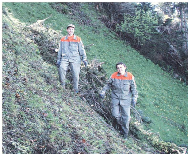
Hier ein Beispiel. Kulturland im steilen Gelände aufräumen war u.a. eine Aufgabe der Zivilschutzformationen aus dem Bündnerland.

Die Einsatzkoordination «Armee/Zivilschutz» wurde Urs Imboden vom Amt