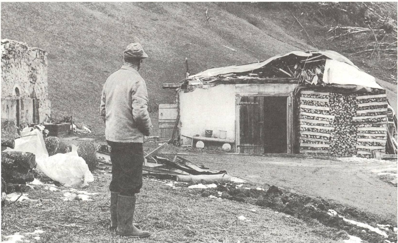
Ein Bauer vor seinen Sturm-Ruinen.

Der Zivilschutz half teilweise unter sehr schwierigen Bedingungen, die vom Sturm »Lothar« verursachten Waldschäden aufzuräumen, und hat einen