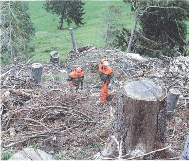
Wurzelstocksicherung durch Zivilschutz-angehörige im steilen Gelände, damit diese nicht auf die Wiesen rollen und eine Gefahr bilden.

für Bevölkerungsschutz und die Gesamtkoordination der Arbeitsplätze wurde Edy Halter vom Oberforstamt übertragen.