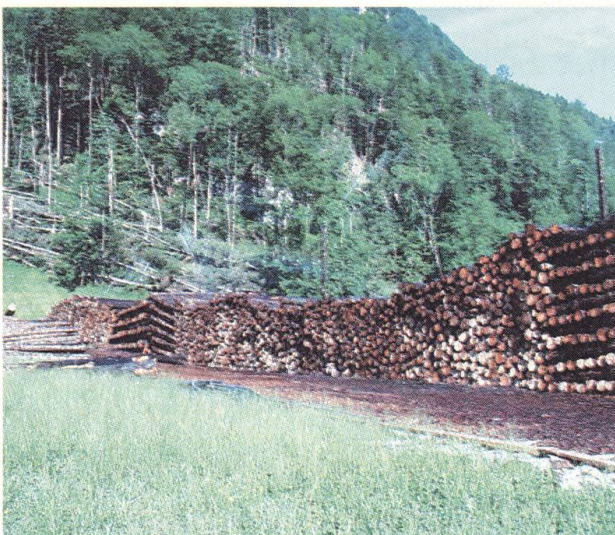
Eines der vielen Nasslager im Kanton. Hier das Lager in Oberdorf.

Bis Ende Oktober 2000 werden rund 60 000 Kubikmeter Holz (25% der Schadenmenge) aufgerüstet sein. Knapp ein Drittel der gesamten Schadholzmenge wird im Wald liegen gelassen. Von diesem gehe keine Gefahr aus, so gemäss Edy