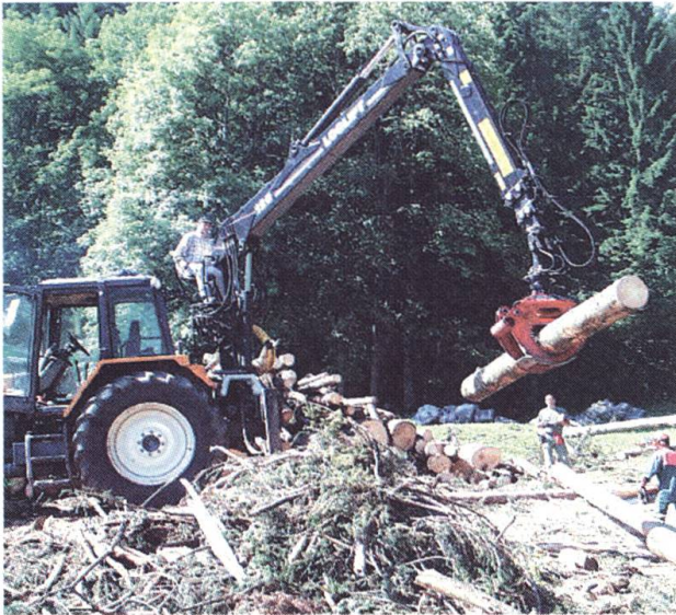
Forstequipen beim Holzsortieren auf dem Lagerplatz.

men der gesamtschweizerischen Katastropheneinsatzplanung wurden dann Teile des Genie Bat 23 (aus dem Raum Ostschweiz und Innerschweiz) und Teile des Rttg Bat 15 (aus dem Raum Basel) im diesjährigen Wiederholungskurs zugunsten des Kantons Nidwalden für unterstützende Arbeiten aufgeboten.