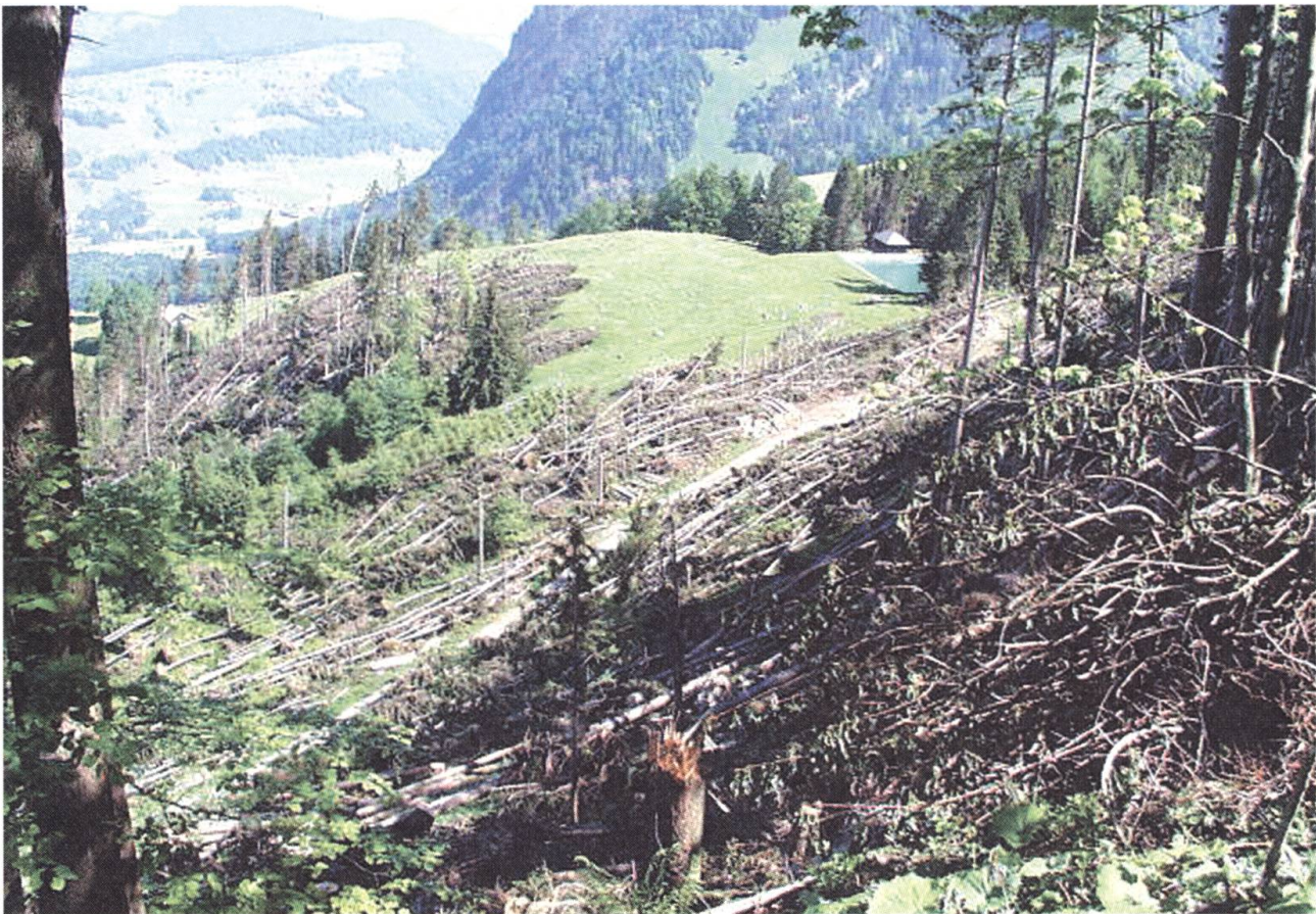
Massiver Waldschaden im Gebiet Ächerli, Stanserhorn