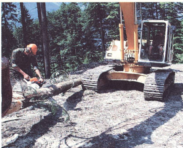
Armeeangehörige haben rund 1400 Dienstage in Nidwalden geleistet. Hier werden zivile Baumaschinen eingesetzt.

Die Armeeangehörigen haben vom 5. Juni bis 12. Juli 2000 rund 1400 Dienst-