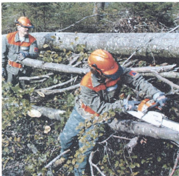
Nidwaldner Zivilschutz mit modernster Ausrüstung. Unzählige Kettensägen mussten eingesetzt werden.

meeangehörige rund 8000 Diensttage für Nothilfeinsätze erbracht. In allen Nidwaldner Gemeinden wurden auf rund 180 verschiedenen Schadenplätzen Nothilfe geleistet.