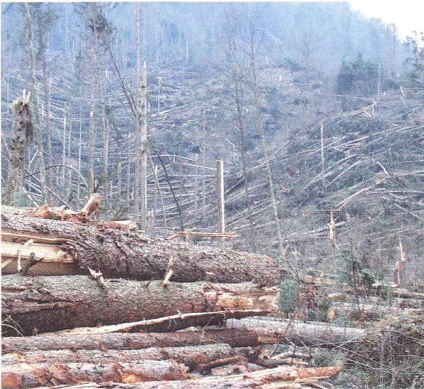
Rund 240 000 Kubikmeter Holz hat der Sturm in Nidwalden vor allem in den Schutzwaldungen zerstört.

einer Fläche von rund 450 ha wurden ca. 150 000 Kubikmeter Holz vom Orkan «Lothar» verwüstet.