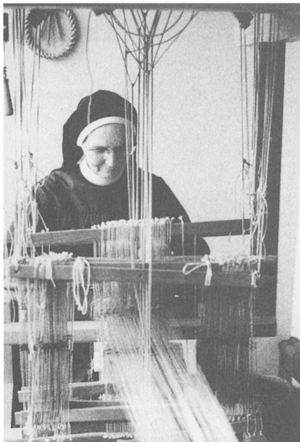
Arbeit am Webstuhl...

Benedikt von Nursia hatte für seinen Orden den Grundsatz «bete und arbeite» geprägt. Danach richteten seit jeher auch die