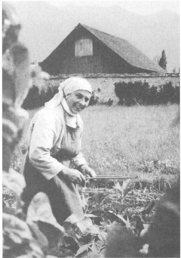
... und im grossen Garten

reisten drei Missionarinnen nach Nordamerika, 1885 folgten ihnen drei weitere Schwestern und eine Novizin. Es entstand in Cottonwood (Idaho) das Frauenkloster St. Getrud.