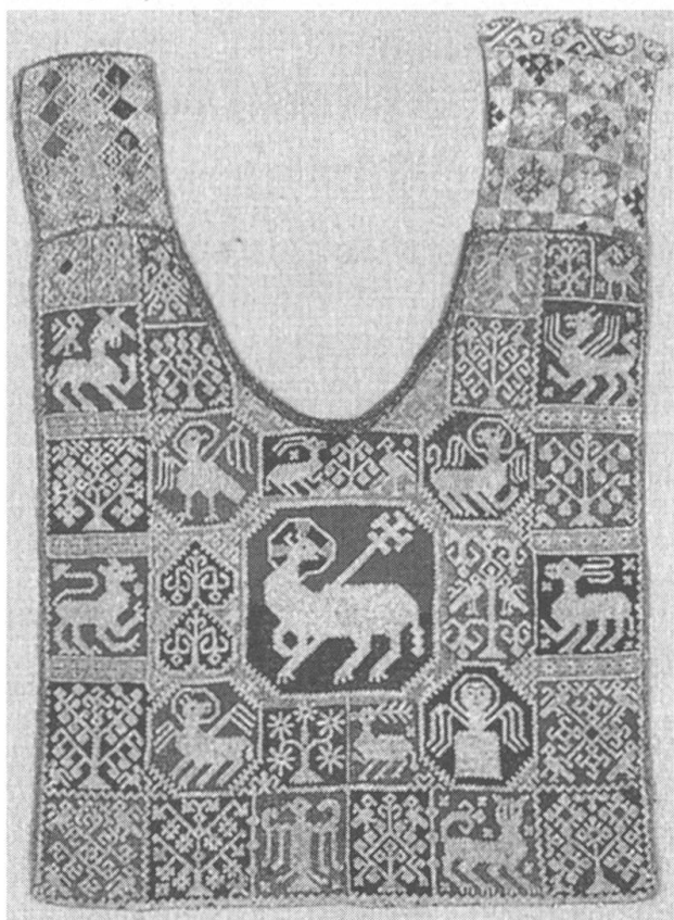
Brustlatz: Leinen- und Seidenstickerei aus dem Kloster St. Andreas, 14. Jh.

Die rasch vollzogene Umsiedlung nach Sarnen hinterliess noch einige Zeit Spannungen zwischen dem Kloster St. Andreas und dem Männerkloster in Engelberg. Dabei stellte sich die Obwaldner Obrigkeit schützend hinter den Frauenkonvent. Für einige Zeit verloren die Engelberger Äbte ihr Visitationsrecht. Während fünfzig Jahren übten dieses Chorherren des St. Leodegarstiftes in Luzern und Äbte von Muri aus, bis 1667 der Bischof von Konstanz nach zähen Verhandlungen dieses Recht dem Abt von Engelberg wieder zustellte. 1722 gab die Regierung dann auch noch ihren Widerstand gegen Beichtiger (Beichtväter und religiöse Berater