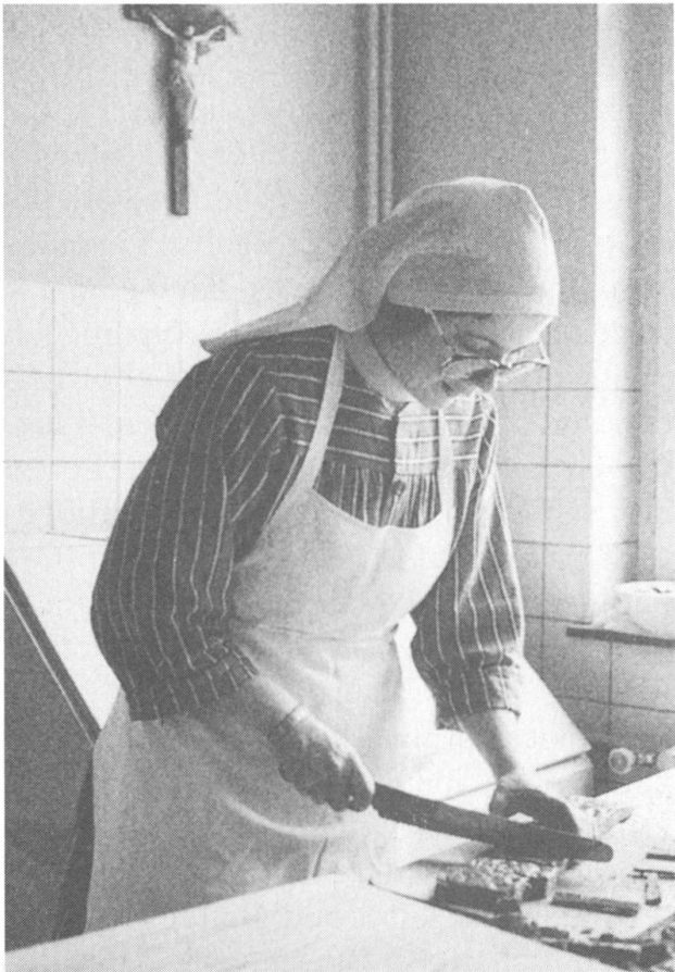
... in der Bäckerei