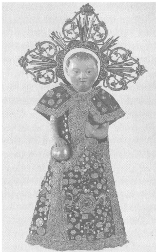
Sarner Jesuskind, anetan mit «Agneskleid», 14. Jh., roter Samt mit Gold- und Silberapplikationen, im 18. Jh. zum Kleidchen umgearbeitet.

für es kostbare Kleidchen. Das bekannteste ist das Agneskleid. Königin Agnes von Ungarn (1281–1364) und ihre Mutter Elisabeth, die Gemahlin des 1308 ermordeten deutschen Königs Albrecht, hatten in Engelberg eine Jahrzeit gestiftet und 1318 schenkte Agnes dem Männerkonvent einen Chormantel mit reichen Stickereien, an denen sie mit eigener Hand