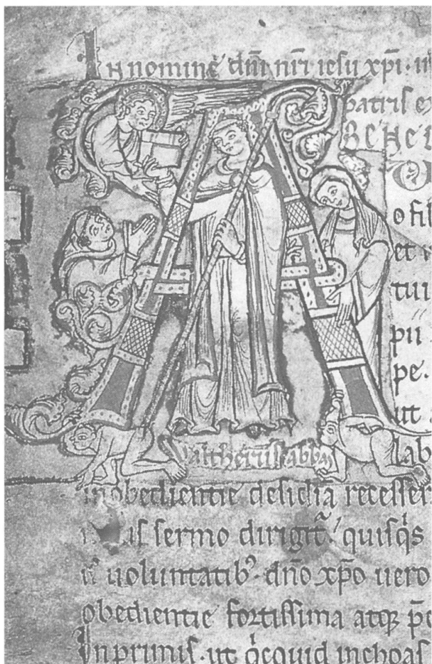
Initiale A mit Abt Walther von Iberg und Meisterin Guota, Codex 72, fol. 1v, Benediktsregel.

In der barocken Kirche, die beim Erdbeben von 1964 arg gelitten hat, war das Kindlein für die Wallfahrer hoch oben über dem Hauptaltar in weite Ferne gerückt. In der neugestalteten Kirche können es heute die Gläubigen in einem Glasschrein zwischen Chorraum und Kirchenschiff von Nahem betrachten.