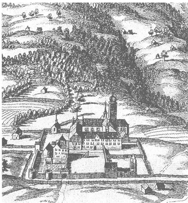
Stich von Matthäus Merian 1642 aus : Topographia, Helvetiae, Rhaetiae et Vallesiae: Unterhalb des Männerklosters ist als Teil der Klostermauer die Ruine der Kirche der Klosterfrauen zu erkennen.

ist in der Klostermauer noch eine Ruine der Kirche der Klosterfrauen zu erkennen. 1449 war das Frauenkloster abgebrannt. Die Meisterin schrieb: «Das Feuer verbrannte unser Gotteshaus und unser Kloster, so dass nichts mehr blieb. Es verbrannte gar köstlich der Mehrheit unseres Kirchenschatzes und auch der Frauen gemeinlich wenig Auskommen.» Mit grösster Mühe brachte die Meisterin die Fi-