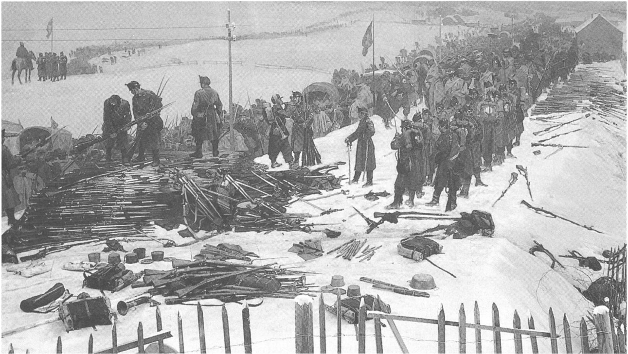
Entwaffnung der Borki-Armee

bäude hängend das Rundgemälde von rund 14 m Höhe und 112 m Umfang. Das Gemälde wurde nicht - wie ursprünglich geplant - zur Wiederherstellung ausgebaut. Die Konservierung und Restaurierung erfolgt in situ, also vor Ort. Die fehlenden Teile im Bereich des Himmels