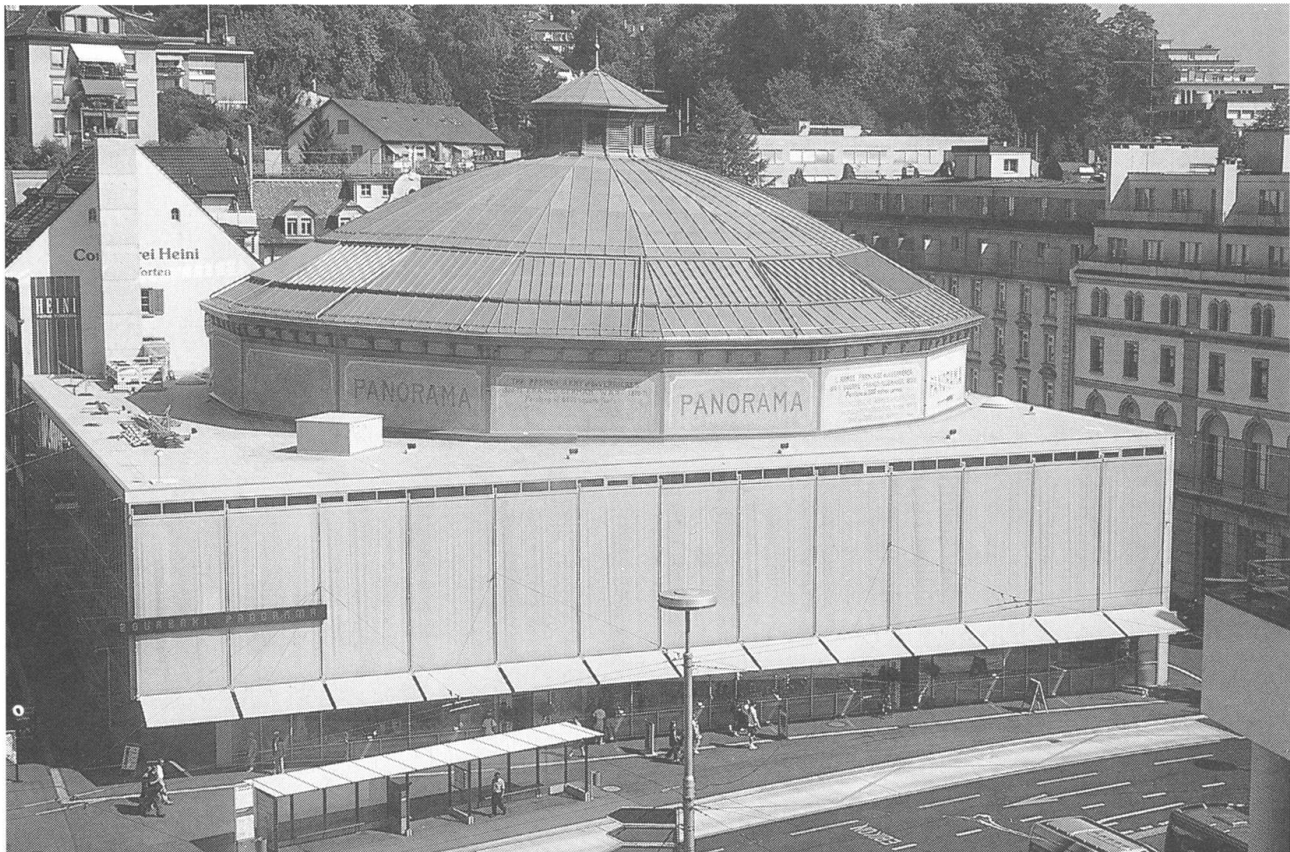
Bourbaki-Panorama; Museum, Stadtbibliothek und Geschäfte