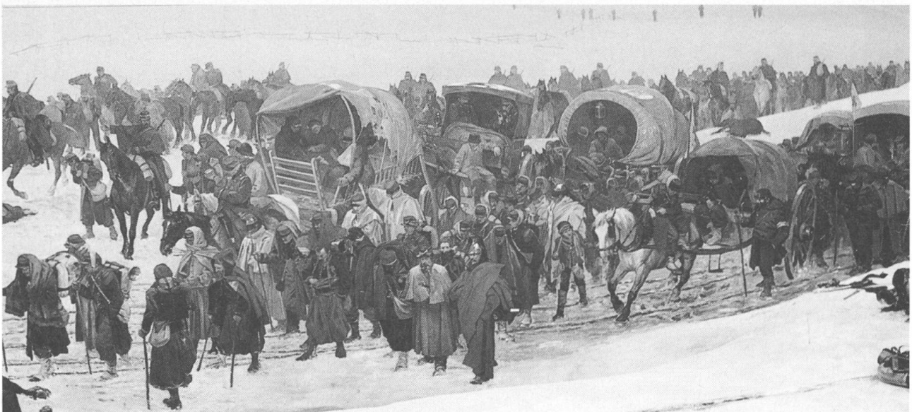
Einmarsch der Borki-Armee ins Asyl

werden nicht ergänzt. Das Gemälde wurde auf das ursprüngliche Aufhängungsniveau abgesenkt. Eine Arbeitsgruppe hat das Konzept für die Bildsicherung während des Umbaus und für die Konservierung und Restaurierung entwickelt. Der «Verein zur Erhaltung des Borki-Pan-