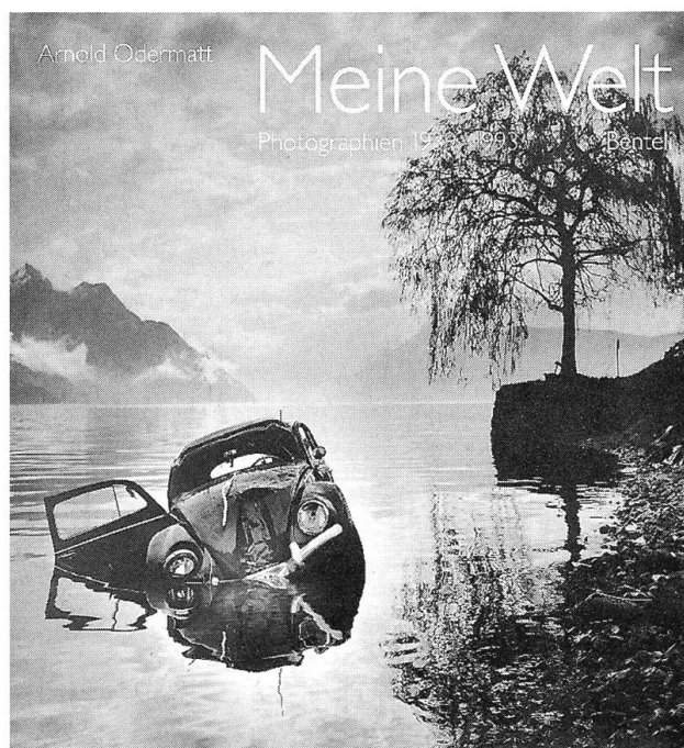
Arnold Odermatt; Meine Welt, Photographien 1939–1993, 2. Auflage 2001, Fr. 85.00, Benteli Verlag, erhältlich im Buchhandel.