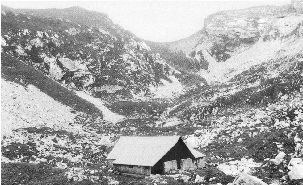
Hütte auf der Gruobalp, im Hintergrund der Passüber- gang Bocki-Rotisand.

dem Wildhüter, sondern er werde ihn erschies- sen. Zudem war im Herbst 1899 in den Wochen vor dem Mord wiederum ein neues Verfahren gegen Adolf Scheuber wegen Wildfrevel hängig.