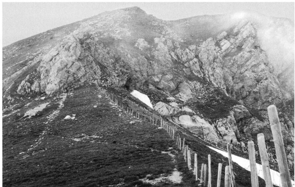
Grenze zwischen Obwalden und Nidwalden beim Übergang Bocki-Rotisand.