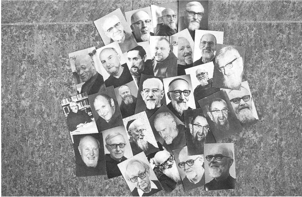
Collage mit Totenbildern

Sogar eigene Gedenktage des Gesamtordens der Minderbrüder kennen die Kapuziner in ihrem Direktorium. So feiern sie das sogenannte "Gedächtnis der Verstorbenen des seraphischen Ordens" gewöhnlich nach dem Festtag des hl. Franziskus von Assisi, am 5. Oktober. Dies schreiben die jüngsten Satzungen des Kapuzinerordens vor (Satzung 49): "Alljährlich soll nach dem Hochfest des heiligen Franziskus in jeder Brüdergemeinschaft das Gedächtnis für alle verstorbenen Brüder und Wohltäter gefeiert werden." Bemerkenswert an dieser Weisung ist die Nennung der verstorbenen Wohltäter. Auch diese werden mit ins Gebet miteinbezogen. Überhaupt beschäftigen sich in den Satzungen des Ordens von 1990 mehrere Bestimmungen mit den Suffragien. Bei der Feier der Eucharistie empfehlen die Kapuziner "in liebender Sorge (...) Gott auch alle Verstorbenen" . Die Art des Gedenkens beim Tod eines Papstes, eines Generalministers und ehemaligen Generalministers usw. ist genau abgestuft geregelt. Es sei sogar Sache des Provinzkapitels zu bestimmen, wie man eines verstorbenen Provinzialministers und eines ehemaligen Provinzialministers, verstorbenen Mitbrüder, Eltern und Wohltäter gedenke. Seit dem Beginn des 20. Jahrhunderts wurden zwei Bräuche in der Schweizer Ordensprovinz eingeführt. Zu jedem verstorbenen Kapuziner wird ein Nekrolog im Provinz-Amtsorgan "Fidelis" in einer der Landessprachen, woher der Verstorbene her stammt,