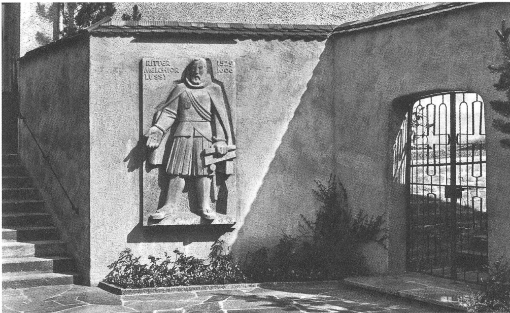
Eingang zur erneuerten Friedhofsanlage im Zustand vom 2. Dezember 1956 (Einweihung).

musste. Die Friedhofsanlage erhielt damit ihre Gestaltung, wie sie sich heute präsentiert. Eine kräftige Umfassungsmauer schützt den Friedhof, wo nach einem kurzen Treppenaufstieg die Gräber auf höher gelegenen Terrassen angeordnet sind. Die Erstellung und Einsegnung des Lussy-Denkmalns an der Friedhofsmauer, geschaffen von Hans von Matt, anlässlich des 350. Todesjahres des Klosterstifters am 2. Dezember bildeten den Abschluss der Erweiterung und Erneuerung des Klosterfriedhofes. Der damalige Maturand und Lyzeist am Kollegium St. Fidelis, Peter von Matt, hernach ein international gefeierter Literatur-Wissenschaftler und Professor der deutschen Sprache, würdigte mit seinem jugendlichen Frühwerk "Denkmalweihe" in der Frühjahrsausgabe des renommierten Kollegiumsorgans "Stanser Student" (14. Jahrgang, 1957, 91–93) die Friedhofsanlage und das Denkmal sehr treffend: "Nun da die jungen Bäume um den Klosterplatz zum ersten Mal im hellen Grün stehn, zeigt es sich so recht, mit welchem Geschick man es im Herbst verstanden hat, die Errichtung des Denksteines für Ritter Lussy mit einer Neugestaltung der gesamten Friedhofsanlage zu verbinden. Denn aus dem engen, misslich gelegenen Friedhof wurde ein gefreuter Bestandteil der ganzen Klosteranlage. So sind nun auch die toten Kapuziner wieder von frommen Mauern gegen die Unheiligkeit der Welt geschützt, und ein schön geschmiedetes Tor lässt jene ein, die ihre verstorbenen Prediger und Beichtväter nicht vergessen haben."