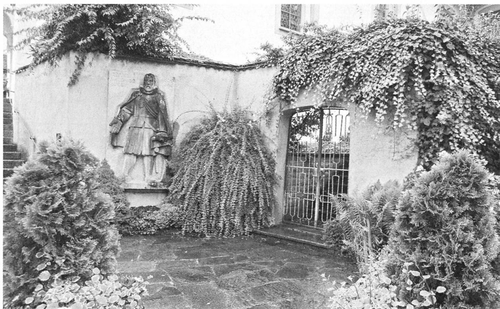
Der Stanser Kapuzinerfriedhof mit Ritter Melchior Lussy, 2004

Im Leben der Kapuziner – und nicht nur bei diesem Orden – ist der Tod kein Tabu. Der hl. Franziskus von Assisi, nach dessen Regel die Kapuziner als Minderbrüder in Armut, Keuschheit und Gehorsam ein evangelisches Leben in der Nachfolge Christi ausrichten, widmet sich in seinem Sonnengesang auch und besonders dem Tod: "Gelobt seist Du, mein Herr, durch unsern Bru-