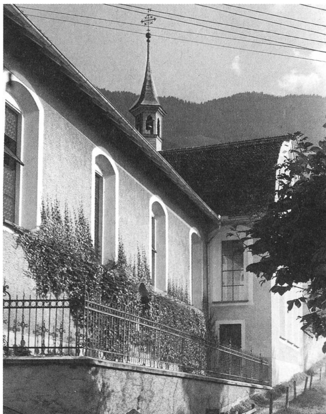
Zweite Friedhofsanlage, 1907–1956

Zürich am 26. Juni 1905, der achte. Heute erhebt sich über dieser ersten Friedhofsanlage die 1907 errichtete sogenannte Fidelis-Kapelle als westlicher Anbau zum Äusseren Chor. Der stetige Zuwachs des Konventes durch Professoren für das eigene Internat und Gymnasium und die stark gestiegenen Studentenzahlen, die an Sonn- und Festtagen den festlichen Ämtern des Konventes beizuwohnen pflegten, sowie durch die