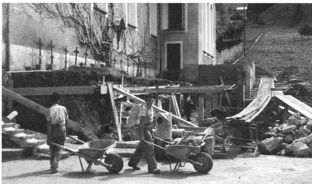
Erweiterung der Friedhofanlage, 1956

1956 wurde im Januar mit der Erweiterung der zweiten Friedhofsanlage begonnen, wo inmitten der Umbauarbeiten der am 6. Juni verstorbene P. Crispin Moser von Appenzell, der Redaktor der "Monumenta Anastasiana" für den Seligsprechungsprozess des Diener Gottes und Missionsbischofes Anastasius Hartmann, beerdigt werden