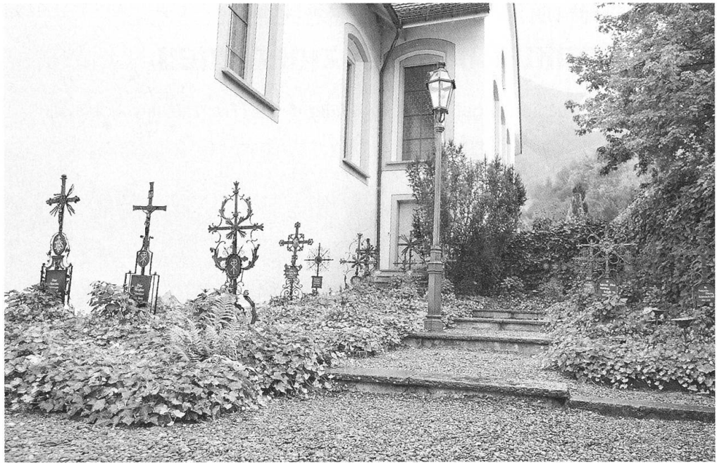
Stimmungsbild vom Friedhof im Jahre 2004

der, den leiblichen Tod, dem nie ein lebender Mensch entrinnt. Weh denen, die in Todsünde sterben! Doch selig, die er findet in Deinem heiligsten Willen; der zweite Tod tut ihnen kein Leides. Lobet und preist, meinen Herrn! Und danket und dienet ihm in grosser Demut! Amen." Leben und Tod, will man Franziskus richtig verstehen, stehen geschwisterlich miteinander oder gegenüber. Die lebenden Brüder gedenken Tag für Tag ihrer verstorbenen Brüder. Exemplarisch dafür zeugt ein ständig geführtes Mortuarium, das Totenbuch. Es ist in jedem Konvent beim Gang zum Inneren Chor, dem Betchor, oder im Refektorium in einem Schaukästchen aufgehängt. Darin sind alle Brüder aufgelistet nach Sterbedatum, chronologisch seit Beginn der Ordensprovinz wie zum Beispiel der Schweizer Kapuziner im Jahre 1589 bis in die Gegenwart. Und Tag für Tag blättert der Bruder Guardian die Seite um, damit jeder der Mitbrüder, die alltäglich an diesem Buch vorbeilaufen, seiner verstorbenen Ahnen gedenkt. Und ist irgendwo ein Mitglied der Ordensprovinz gestorben, so wird in allen Niederlassungen mit entsprechendem Sterbetag der Eintrag gemacht. So ist dies auch in Stans praktiziert worden, bis zuletzt zu dem Moment, als der Konvent infolge Aufhebungsbeschluss leider aufzuhören hatte. Selbst in die Liturgie reicht die Praxis des Gedenkens an die verstorbenen Mitbrüder hinein. Das Ordensdirektorium, ein Liturgiekalender, erinnert Jahr für Jahr mit Einträgen zu den einzelnen Tagesgebets- und