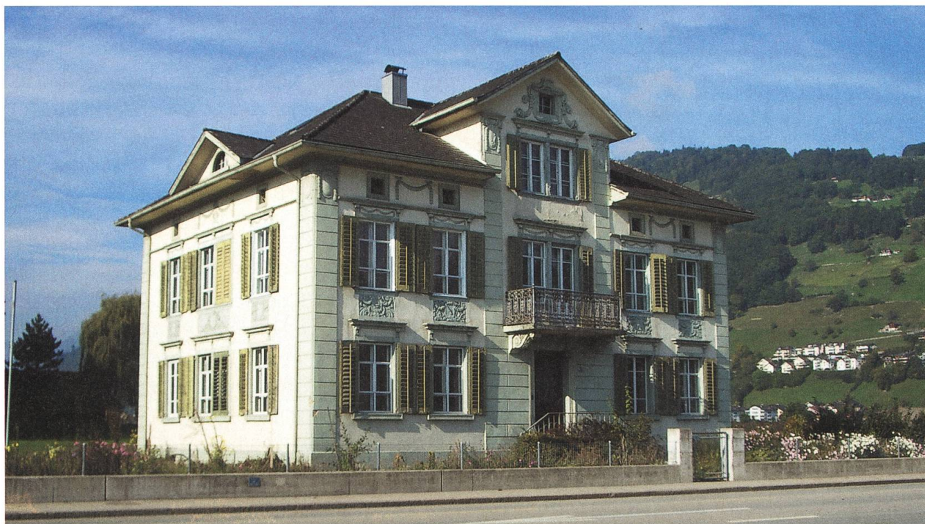
Wohnhaus Ennetbürgenstrasse 53, Buochs, Aussenansicht von Osten (Unterschutzstellungsverfahren beim Verwaltungsgericht hängig).