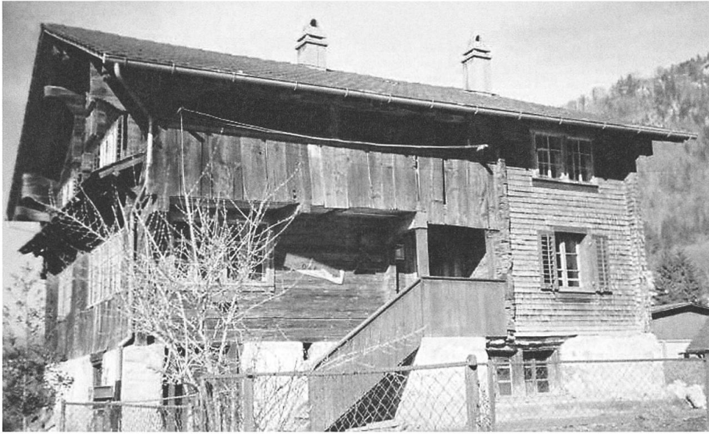
Wolfenschiessen: «Chilähuisli», Aussenansicht von Südwesten vor der Restaurierung.