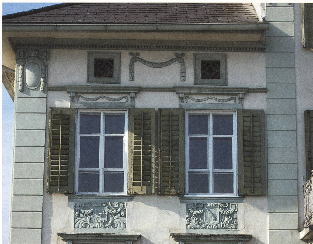
Wohnhaus Ennetbürgenstrasse 53, Buochs, Fassade (Detail).