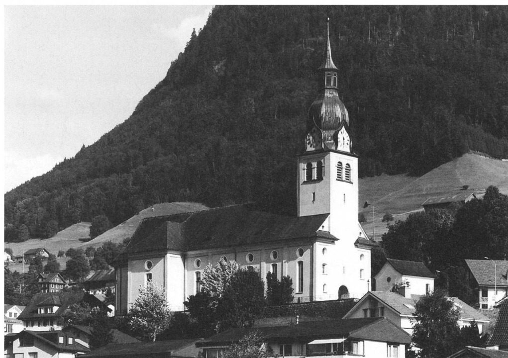
Buochs: Pfarrkirche St. Martin, Aussenansicht von Nordwesten, vor der Restaurierung.

Restaurierungsmaßnahmen: Die Aussenrestaurierung wurde vor allem wegen des schadhaften Daches und notwendiger Spenglerarbeiten am Turmhelm aber auch wegen weitgehender Ero-