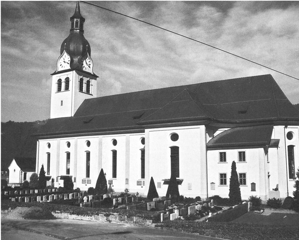
Buochs: Pfarrkirche St. Martin, Aussenansicht von Südosten, nach der Restaurierung.

sion des Deckputzes notwendig. Da diese Arbeiten eine vollständige Gerüstung des Bauwerks notwendig machten, war es angezeigt auch kleinere anstehende Instandsetzungsarbeiten an den Fassadenflächen, Dachuntersichten, Fenstern und im Sockelbereich vorzunehmen. Eine Rückführung des Bauwerks in einen Zustand vor 1936 wurde wohl diskutiert, kam aber allein schon aufgrund der dürftigen Befundlage nicht in Betracht (Farbfassungen und Verputzstrukturen aus der Entstehungszeit haben sich keine erhalten). Ausgangspunkt für die Aussenrestaurierung bildete daher der Zustand von 1936, der als Ausdruck seiner Zeit den Bau gesamthaft neu interpretierte und sich bis heute praktisch unverändert erhalten hat. Die etwas kühle, dem neuen Bauen verpflichtete Grundhaltung der 1930er Jahre, die das spätbarock-klassizistische Aussehen der Kirche zu entschlacken suchte, hat das Bauwerk in den vergangenen Jahrzehnten geprägt und ist Teil der Geschichte geworden. Das Restaurierungsziel war es daher, den Zustand von 1936 zu erhalten bzw. wieder herzustellen. Zu den wichtigsten Instandsetzungs- und Restaurierungsmassnahmen zählten, die Neueindeckung des Daches, das Erstellen eines Unterdaches, Sicherungsmassnahmen am Dachstuhl