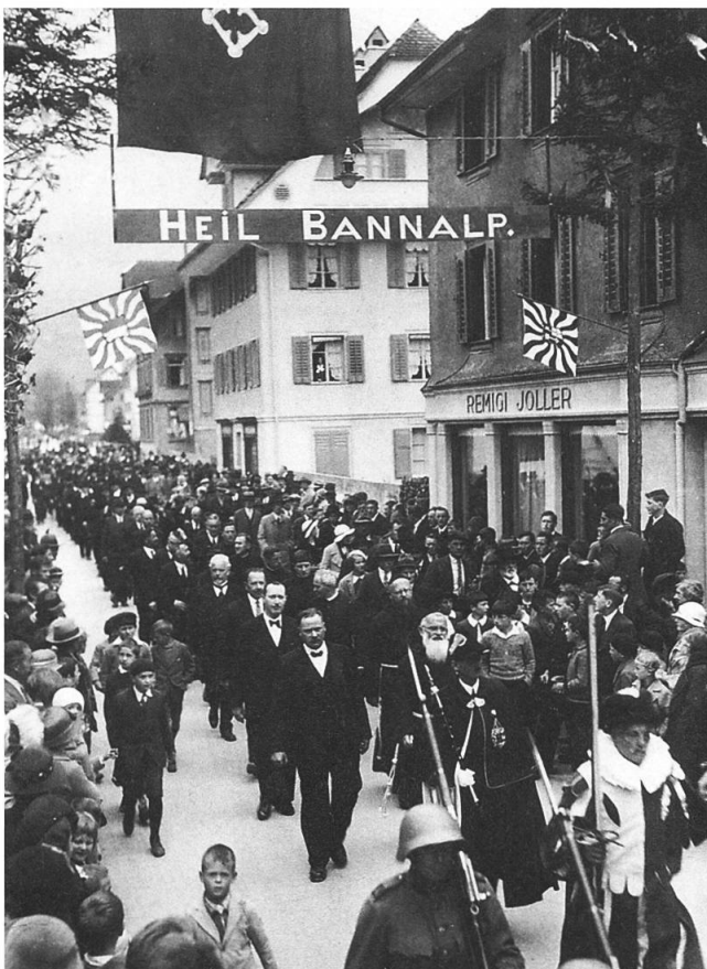
Einzug in Stans nach der Landsgemeinde 1935.