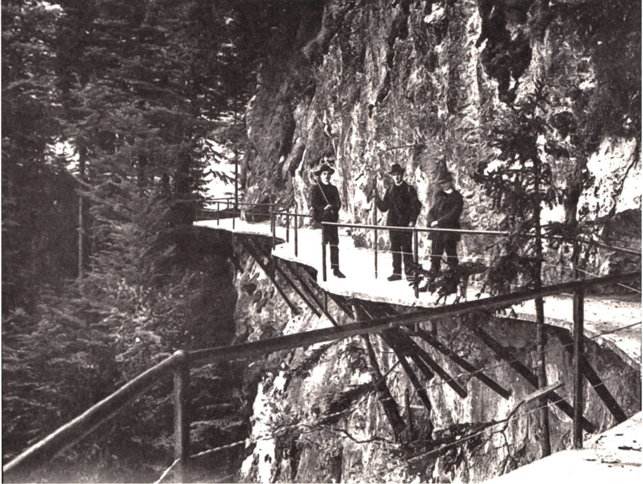
Die Eröffnung des Felsenwegs war im Jahre 1905 ein Weltereignis.

Meter pro Sekunde war der Hammetschwandlift der schnellste Aufzug seiner Zeit in Europa! In einer Kabine aus Fichtenholz, überzogen mit Zinkblech, wurden sechs bis acht Personen binnen dreier Minuten über 160 Meter auf die Felsenase auf der Hammetschwand-Alp befördert. Die Talstation wurde auf 961 Meter über Meer und rund 500 Meter über dem Seespiegel des Vierwaldstättersees in den Fels gehauen. Die Bergstation befindet sich auf 1114 Meter über Meer.