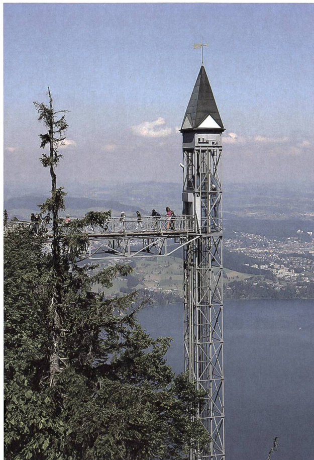
Der Hammetschwandlift transportiert 40'000 Passagiere pro Jahr.

So unter anderem: Konrad Adenauer, Charlie Chaplin, Clara Haskil, Georges Simenon, Jimmy Carter, König Gustav von Schweden, Marcel Reich-Ranicki, Sean Connery, Golda Meir, Helena Rubinstein, Henry Kissinger, Prinz Hassan von Jordanien, Joan Fontaine, Rose Kennedy, Shirley MacLaine, Marcel Marceau, Olivia de Havilland, Wernher von Braun, Yul Brynner, Audrey Hepburn, Sophia Loren. Die Liste liesse sich noch lange weiterführen.