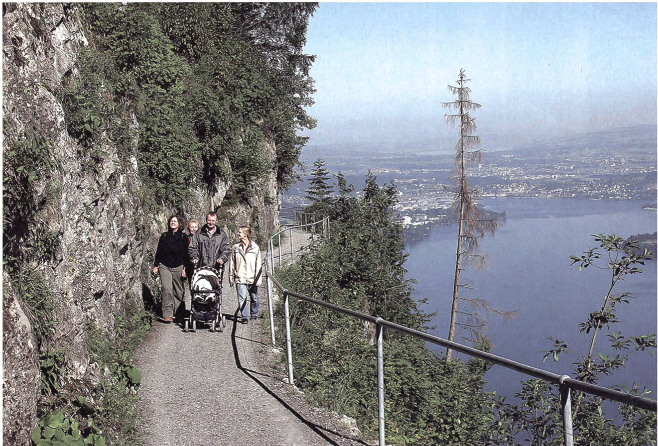
Der Felsenweg belohnt Wanderer mit einer atemberaubenden Aussicht.