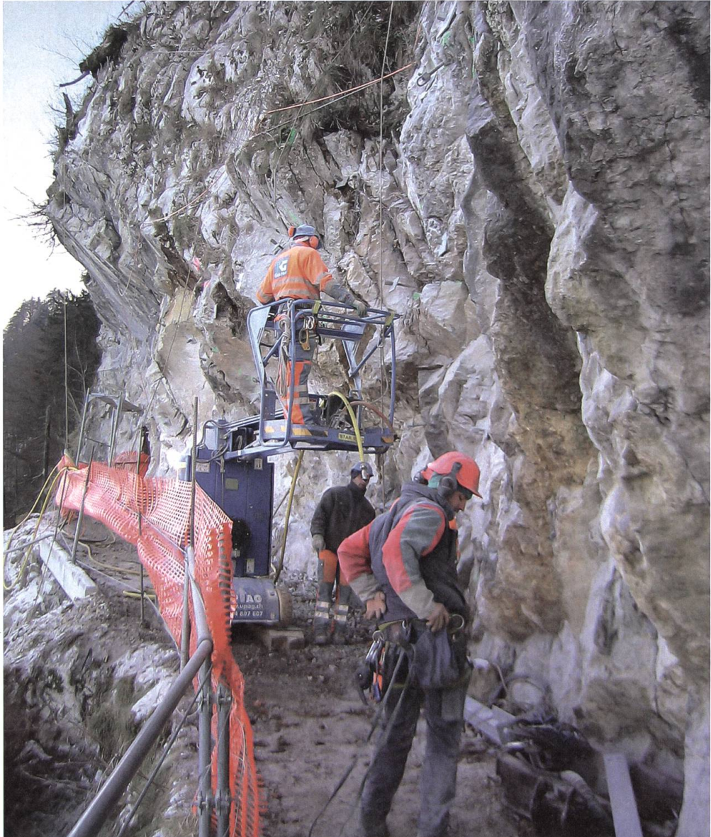
In zehn Monaten wurde der 2650 Meter lange Felsenweg umfassend saniert.

der Schweiz und wurde bis ins Jahr 1995 mit Strom eines von Bucher-Durrer eigens dafür gebauten Wasserkraftwerks versorgt. Der Weg dazu war jedoch nicht einfach: Erst nach einer fast zweijährigen Auseinandersetzung mit dem Schweizerischen Eisenbahndepartement erhielt Joseph Bucher-Durrer am 8. Juli 1888 vom Bundesrat die Betriebsbewilligung. Im selben Zeitraum entstanden auf dem sich prächtig entwickelnden Bürgenstock das Park Hotel sowie die Infrastruktur zur ersten Wasserversorgung. Und weil die 340 Betten der beiden Hotels der Nachfrage nicht mehr genügten, wurde 1904 – als dritter Betrieb – das Palace Hotel mit 160 Betten eröffnet.