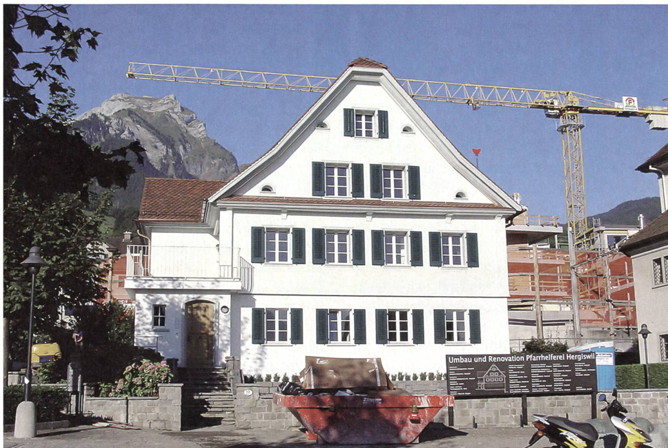
Hergiswil: Pfarrhelferei, Ansicht von Süden.