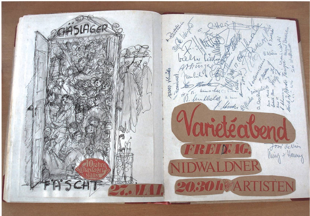
Aus einem Veranstaltungsband des Chäslagers.

die Veranstaltungen in Bild und Text, mit Fotos und Zeitungsartikeln verzeichnet sind sowie eine reiche, äusserst interessante Plakatsammlung. Der Katalog der Kantonsbibliothek verzeichnet zudem neben verschiedenen Artikeln zu diversen Anlässen auch Publikationen und Kataloge, die anlässlich der Ausstellungen von Nidwaldner Künstlern entstanden sind. Natürlich fehlen die drei Chäslager-Zeitungen nicht, die von den Rovern in den unruhigen Jahren 1968 und 1969 herausgegeben wurden und heute noch durch ihre Unbekümmertheit und Frische bestehen. Der Zürcher Schriftsteller Max Frisch war so begeistert von der Ausgabe über das Wiener Festival, dass er sie im Zug vom Tessin in die Deutschschweiz dem Rekruten Otto Odermatt