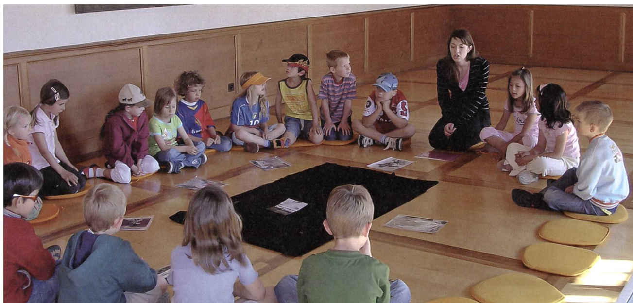
Workshops im Nidwaldner Museum führen Kinder an die Kunst.

Der internationale Museumstag im Mai war dieses Jahr dem jungen Publikum gewidmet. Auch das Nidwaldner Museum beteiligte sich an dieser