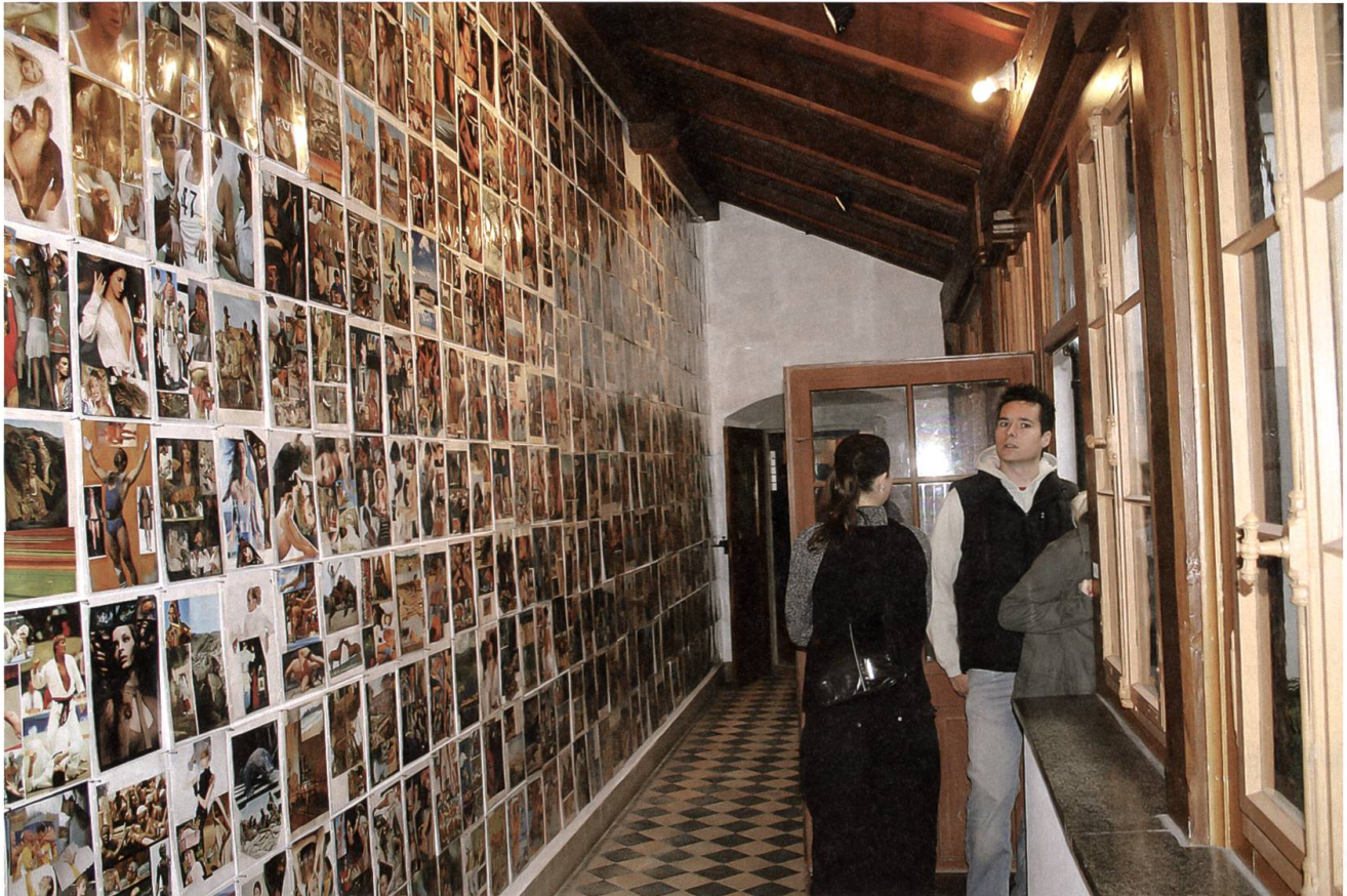
Kunst in Nidwalden ist so vielseitig wie diese Bilderwand an der NOW 05.

Aktion. Alle Museen boten freien Eintritt, und zudem fanden verschiedene Aktivitäten für die jüngeren Museumsbesucher in der Ausstellung Paul Stöckli und in der Festung Fürigen statt.