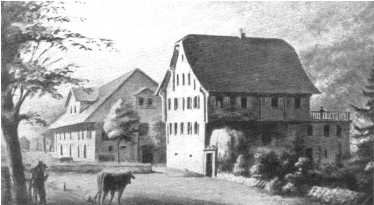
Die «Spichermatt» um 1860.

Zimmer der «Spichermatt», «um sie», wie er richtig vermutete, «wahrscheinlich nimmer zu bewohnen».