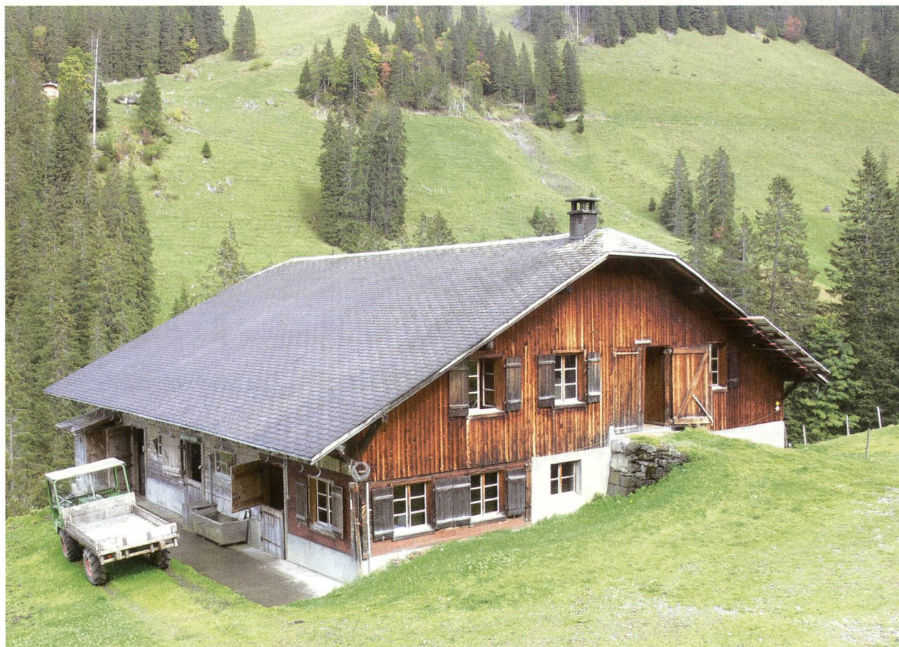
Die Alp Brändlisboden oberhalb von Beckenried.