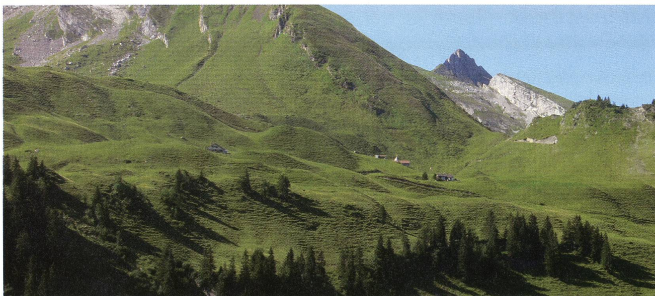
Die Klewenalp im Panoramablick.

Die Kombinationsvariante des Projekts sieht eine Sanierung des Viehtriebweges vor. Im Zeitpunkt der Niederschrift dieses Beitrages liegt die Stellungnahme der kantonalen Ämter noch nicht vor. Kein Interesse hat die Alpverwaltung an einer Intensivierung der Alp, zumal sie ansonsten die Förderung gemäss Natur- und Heimatschutzgesetz (NHG-Beiträge) verlustig gehen würde. Frühzeitige Gespräche mit den Naturschutzorganisationen erachten die Bannwarte als wichtig, damit sie sich bereits im Zeitpunkt der Planung zum Vorhaben äussern können. Nicht tangiert von den Massnahmen wird die raumplanerisch bedingte alpwirt-