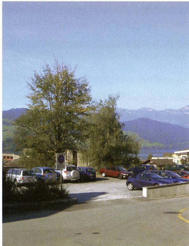
Buochs, Zustand nach Abbruch des Schulhauses (2007).