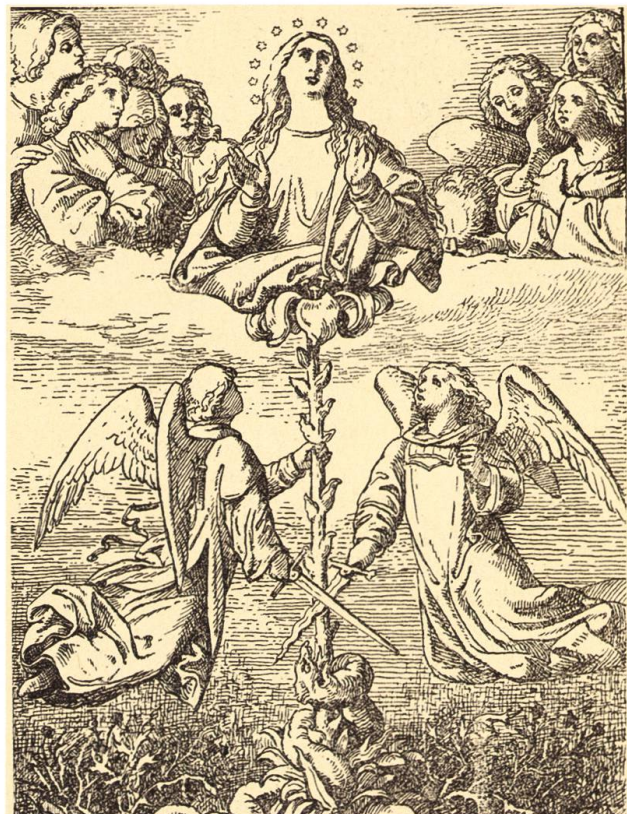
Theaterstücke, eine Karikatur zum aufkommenden Tourismus in Engelberg und natürlich religiöse Themen.