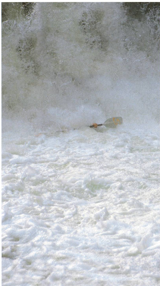
Erfahrene Kanuten kennen keine Furcht: volle Action!

Dabei wurden die Kanuten sogar als Mitbenutzer einer Mehrzweckhalle eingeplant. Aber das Vorhaben erlitt in erster Linie wegen der geplanten Mehrzweckhalle Schiffbruch, als es den Buochser Stimmbürgern vorgelegt wurde; in der Folge wurde im Bau- und Zonenreglement ein Verbot für Hochbauten in einem Teil des Gebiets Seefelds, beim Strandweg, erlassen. Zudem hatten die schweren Überschwemmungen nach dem Unwetter von Ende August 2005 gezeigt, dass auf dem Seefeld nur ganz bestimmte, speziell vor Hochwasser geschützte Bauten möglich sind.