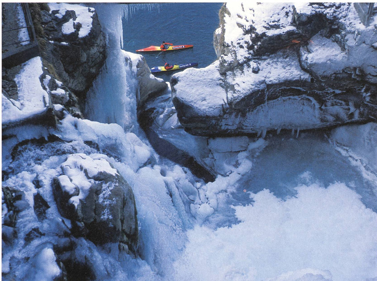
Kanu-Romantik und Ausdauertraining in einem: Kanuten machen in der kalten Jahreszeit keine Pause.