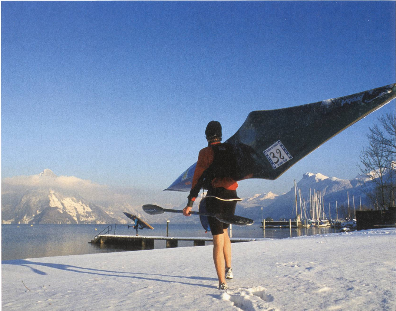
Das Klubhaus ist ungenügend. Die Sportler müssen sich in Schnee und Kälte umziehen, bevor sie in Buochs ihre Boote wassern.

Das schränkt den Spielraum für den Kanuclub weiter ein. Finde der Kanuclub aber eine Lösung für diese Probleme, sei er am See am richtigen Ort, sagt die Buochser Gemeindepräsidentin: «Die Sport- und Freizeitzone ist am See, und die Kanuten brauchen den Fluss und den See. Aber man muss zwingend die Gesamtsituation anschauen. Die Mehrzweckanlage wird zwar jetzt nicht gebaut, aber der Camping und der Bootshafen sollen trotzdem erweitert werden.»