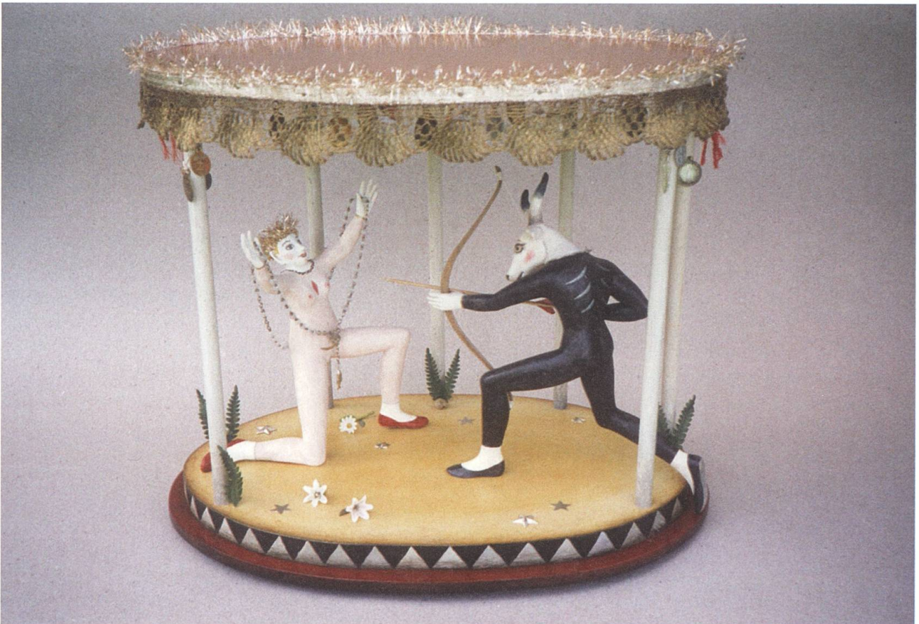
Wunder Punkt 2004