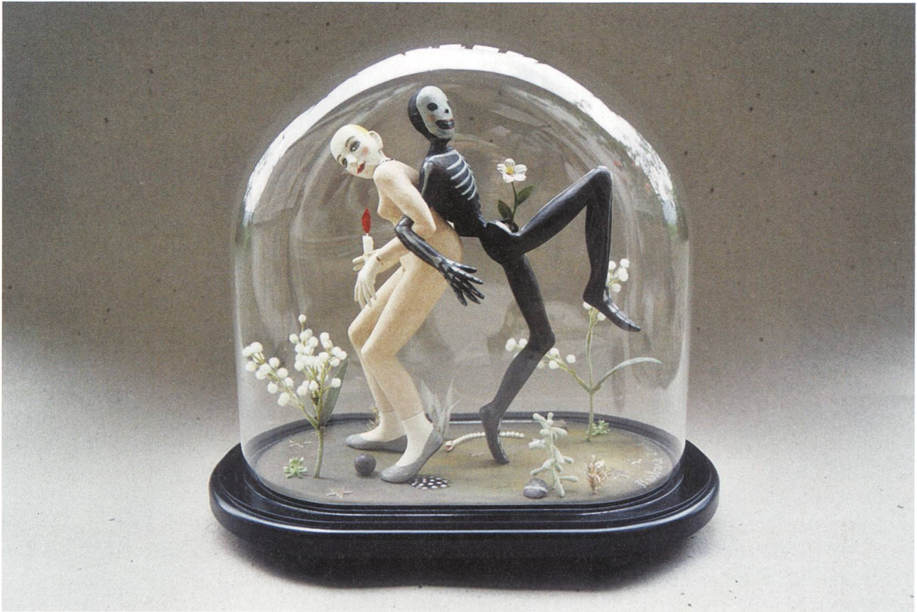
Tanz in die Dunkelheit