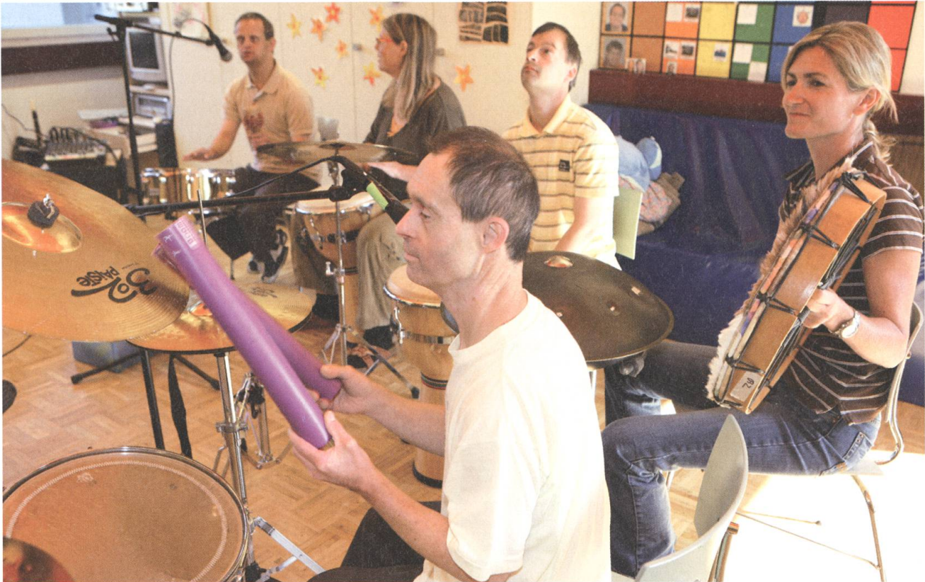
Klänge erkunden und sich gleichzeitig ausdrücken: Musikstunde im Klangatelier der Tagesstätte.

Wie bei der Tagesstätte gilt auch hier: Die Fähigkeiten der einzelnen Mitarbeitenden werden gezielt gefördert, und die Menschen freuen sich, einer sinnstiftenden Arbeit nachgehen zu können. Und letztlich steht und fällt der Erfolg der Heilpädagogischen Werkstätte mit ihren Mitarbeiterinnen und Mitarbeitern.