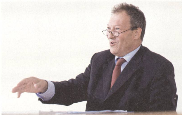
«Wenn man als Versicherung kalkulieren will...