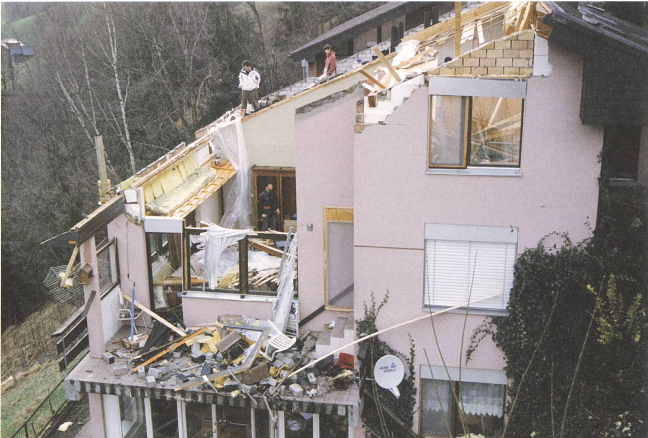
Dach weg: Der Sturm Lothar richtete 1999 grosse Schäden an.