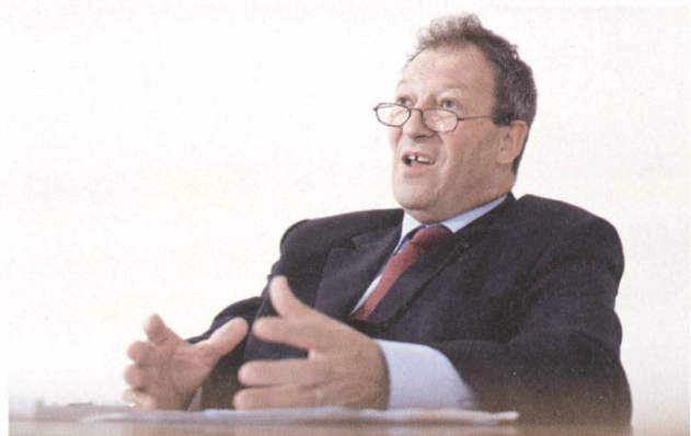
...muss man Naturereignisse...

Und wir haben mit System angefangen, uns als Versicherung selber zu versichern. Anfangs haben wir diese Rückversicherungen eingeführt bei