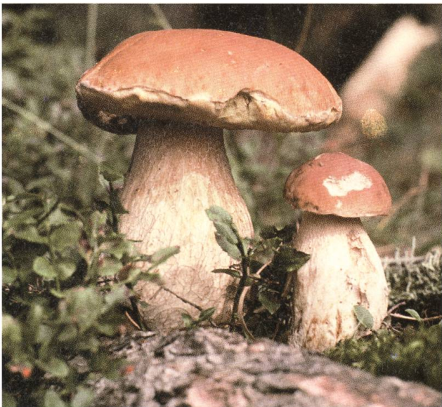
Der König: Steinpilz.