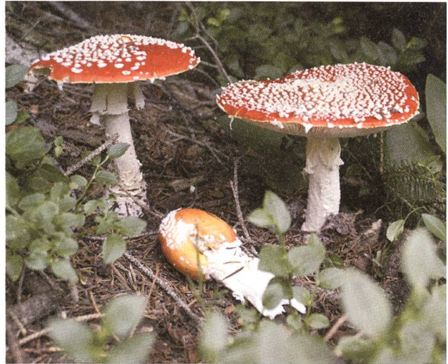
Das Männlein steht im Walde: Fliegenpilz.