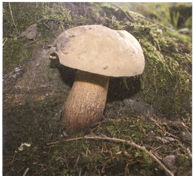
Ungekocht giftig: Netzstieliger Hexenröhrling.