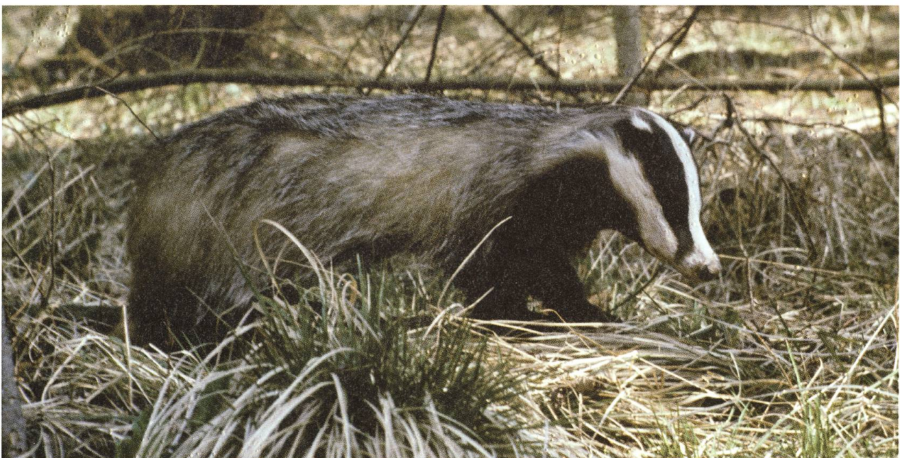
Passionierter Sammler: Der Dachs ernährt sich gerne von allerlei Pilzen.

Menschen sind übrigens nicht die einzigen