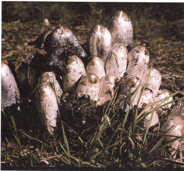
Zu kochen wie Spargel: Schopftintling.