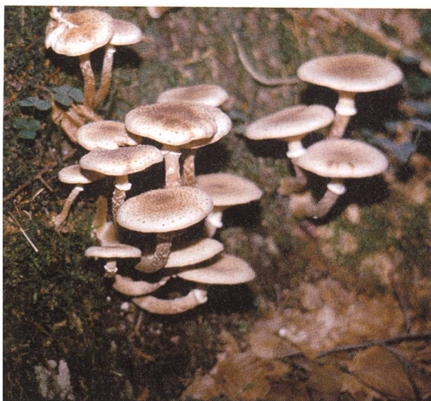
Hieß früher «Italienerpilz»: Hallimasch.