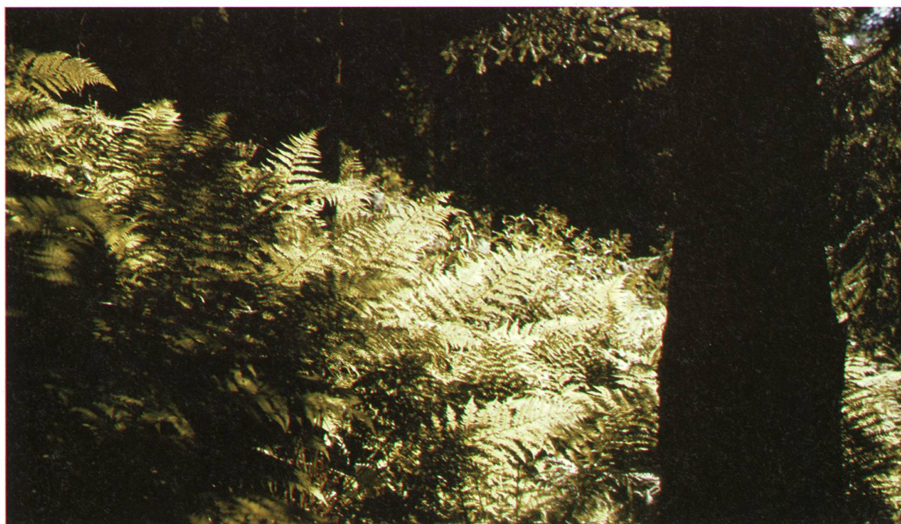
Nidwaldner Bergwälder sind ausgezeichnete Pilzgebiete: Oft sind die Pilze gut in Farn und Moos getarnt.

Möchte man auch noch wissen, was man denn da zwischen Kernwald, Buochserhorn, Ächerli und Grafenort so alles finden kann, braucht man nur das alte Rezept für die Gemischte Pilzsuppe zu lesen: Da gehören Steinpilze, Totentrompeten, Eierschwämmchen, Stockschwämmchen, Maronen, Waldchampignon und noch viele andere Pilze hinein. Gereinigt und geschnitten!