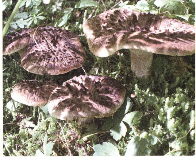
Würzig: Habichtpilz, auch Rehpilz genannt.