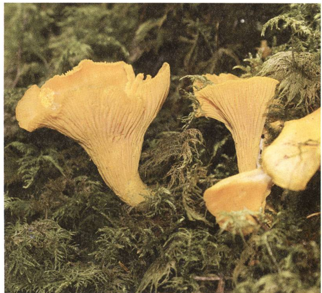
Auch Pfifferlinge genannt: Eierschwämme.