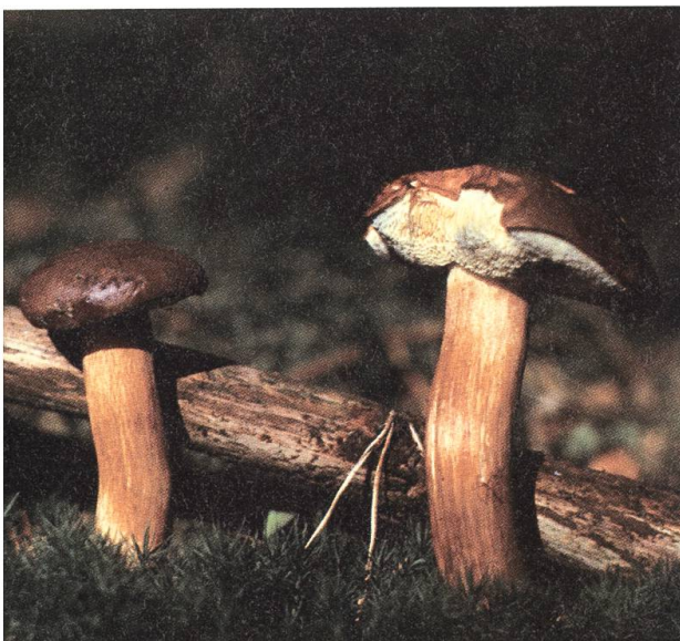
In Talwäldern häufig: Maronenröhrling.