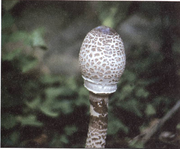
Geniesser-Favorit: Der Parasol.