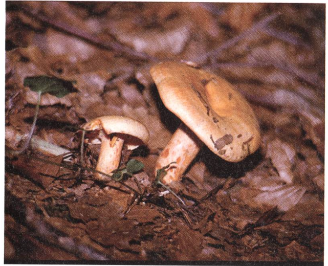
Kaum zu verwechseln: Der Reizker.