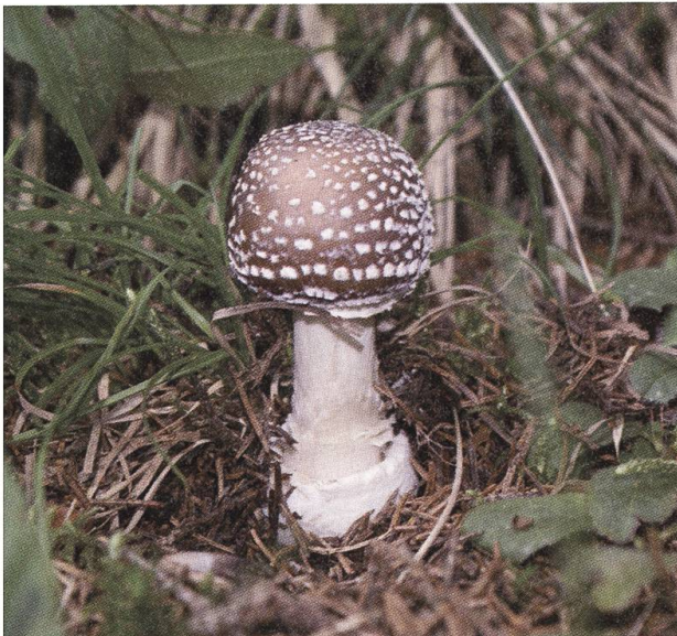
Giftig: Pantherpilz: Ähnelt dem Perlpilz.