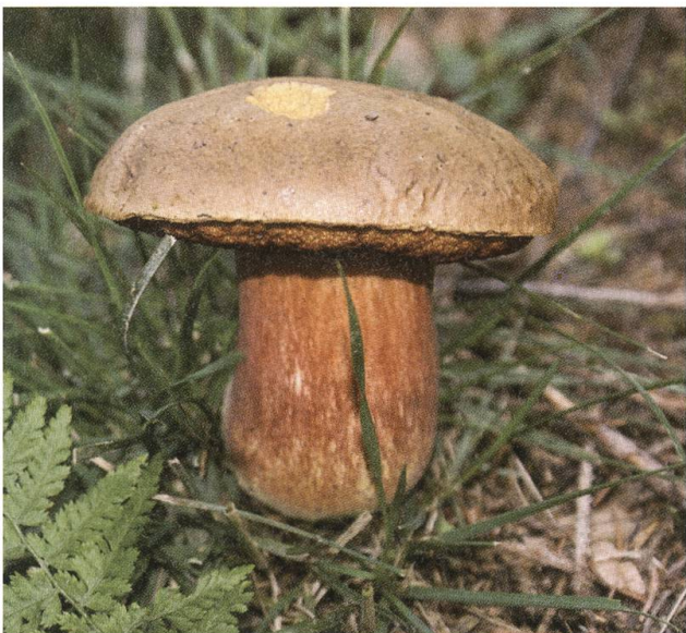
Geniessbar: Flockenstieliger Hexenröhrling.