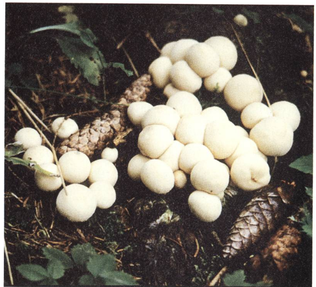
Ideal im Salat: Bovist.