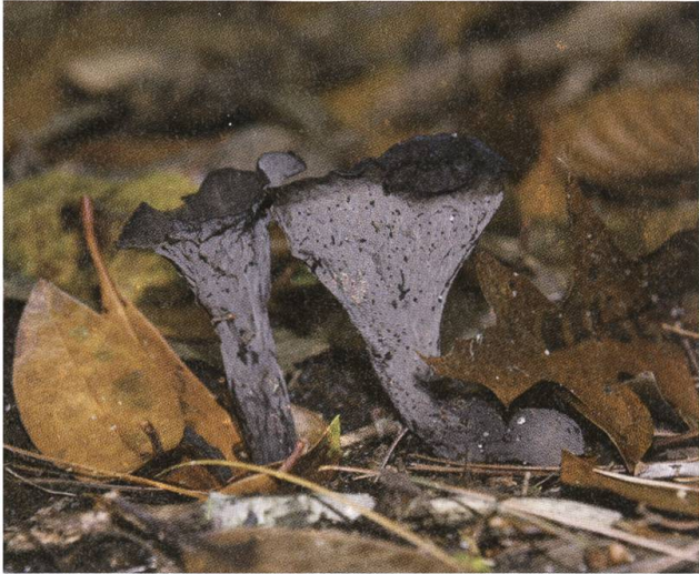
Böser Name, guter Geschmack: Totentrompete.