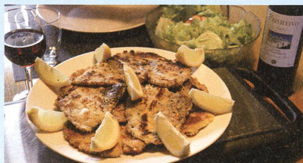
Falsches Wiener Schnitzel: Gebackener Parasol.

Pilzhüte trockentupfen. Mit Salz und Pfeffer bestreuen. Die Eier in einem Teller leicht ver schlagen. Die Parasole im Mehl wenden, dann durch die Eier ziehen, schliesslich im Paniermehl wälzen. Reichlich Öl in einer Pfanne erhitzen, die Pilze 2 bis 3 Minuten auf beiden Seiten knusprig braun backen. Ganz frisch und heiss mit Zitronenscheiben servieren. Dazu schmeckt Tatarsauce und Salat.