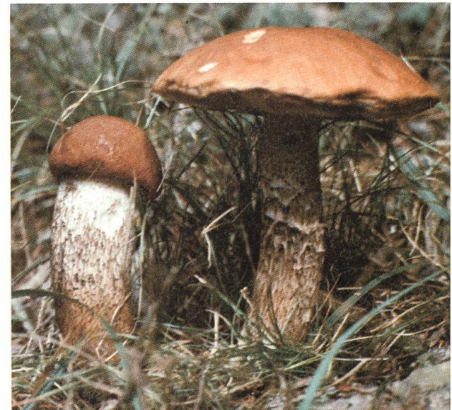
Schön und lecker: Rotkappen.