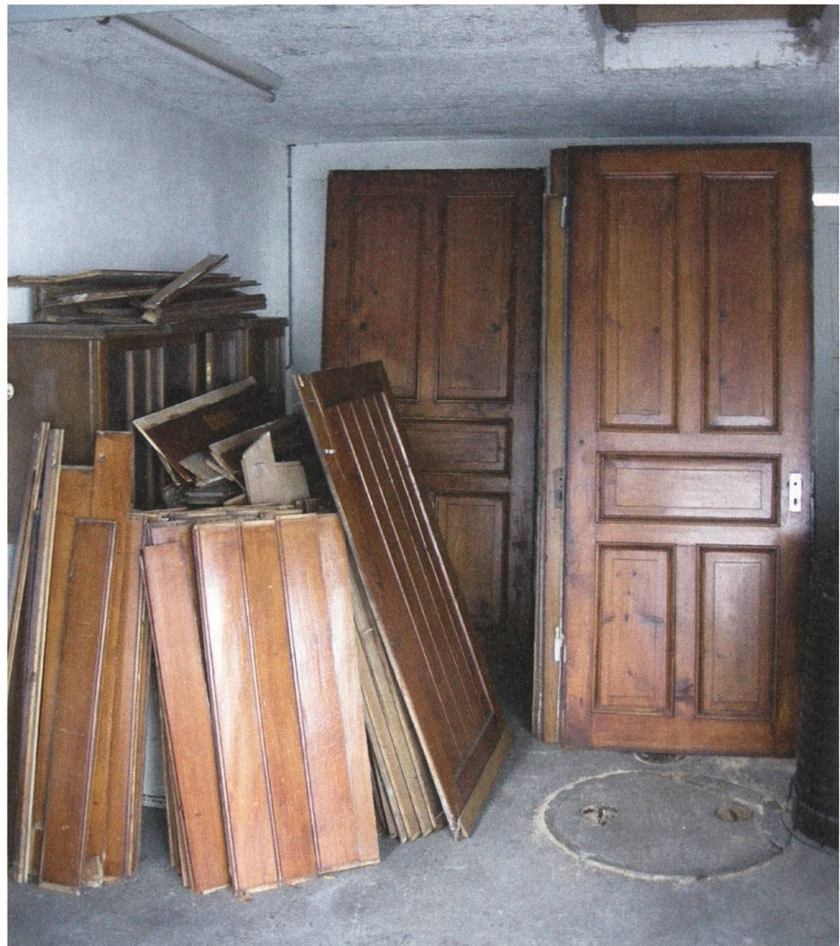
Die Nachnutzung von historischen Bauteilen hat eine weitreichende Tradition. Wandtäfer und Türen stehen in einer Garage zum Weiterverkauf bereit.

Für das Objekt Vorder Breiten hatte das entsprechende Folgen. Eine Unterschutzstellung wurde 2009 unter anderem nicht möglich, weil die originale Ausstattung fehlte und das Haus einen ärmlichen Eindruck hinterliess. Obwohl der Untersuch ein Baujahr um 1450 feststellte und der Grundriss original vorhanden war, hatte das Haus keine Chance. Nur die vom Gebrauch der Jahrhunderte gezeichnete Eingangstüre mit dem typischen Eselsrücken hatte sofort Gefallen gefunden. Ein wortkarger Händler hat sie sorgfältig ausgebaut.