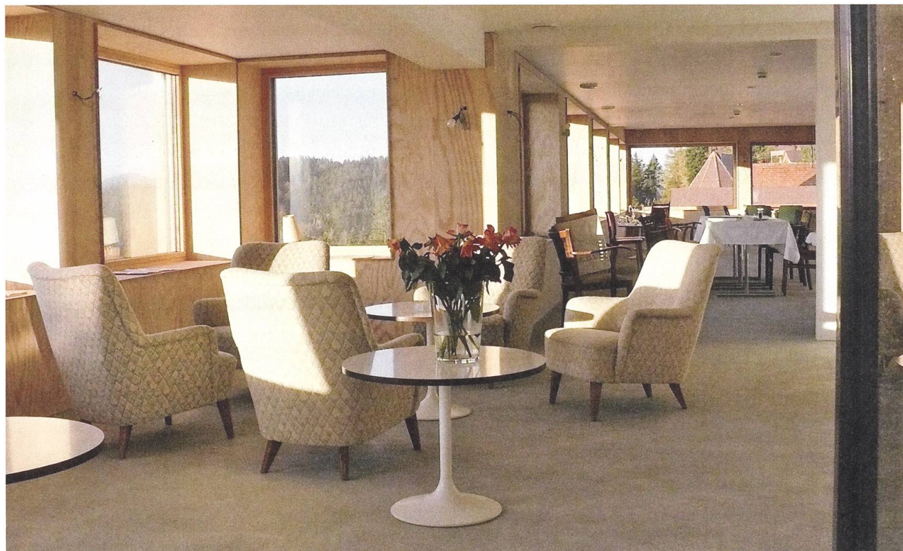
Die Fauteuils im Hotel Alpenhof in Oberegg im Appenzell stammen aus den Beständen des Bürgenstocks. Hier werden die Möbel zu Schmuckstücken, auf dem Bürgenstock hatten sie hingegen keine Zukunft mehr.

Mittlerweile ist aber auch der Bürgenstock zur Fundgrube geworden: Die Fauteuils im Hotel Alpenhof, das von einer Genossenschaft als Kulturort in Oberegg im Appenzell betrieben wird, stammen aus den Beständen des Bürgenstocks. Im Sommer 2009 wurden sie auf den Verkauf des Mobiliars der Bürgenstockhotels aufmerksam gemacht. Die Häuser Palace, Grand Hotel und Waldhaus sollten geleert werden. Alles, was zu haben war, wurde im Internet aufgelistet: stapelbare Stühle (Castelli), Polstersessel, Sofas, Betten, diverse Tische, Spiegelkonsolen, Lampen, Bilder usw. «Wir haben für rund 32'000 Franken eingekauft», erinnert sich Frau Schoch vom Verein