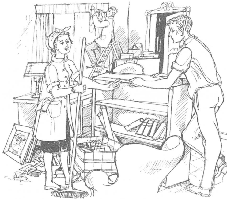
Im ersten Stock wurden neue Vorhänge montiert, Möbel aufgestellt, Akten und Bücher eingereiht.