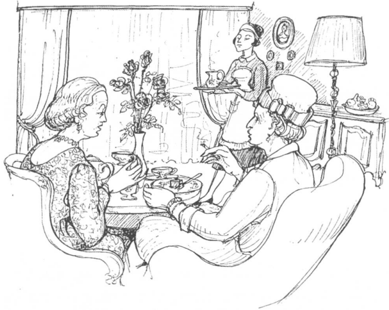
In Polsterseffel versunken, knapperten die Damen am Gebäck.