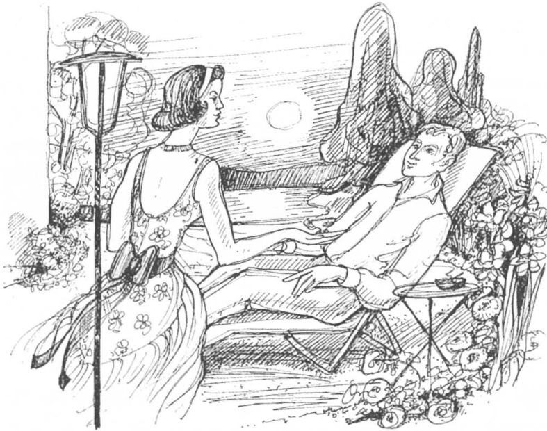
Das hübsche, schlanke Mädchen ist rührend besorgt um den Heimkehrer.