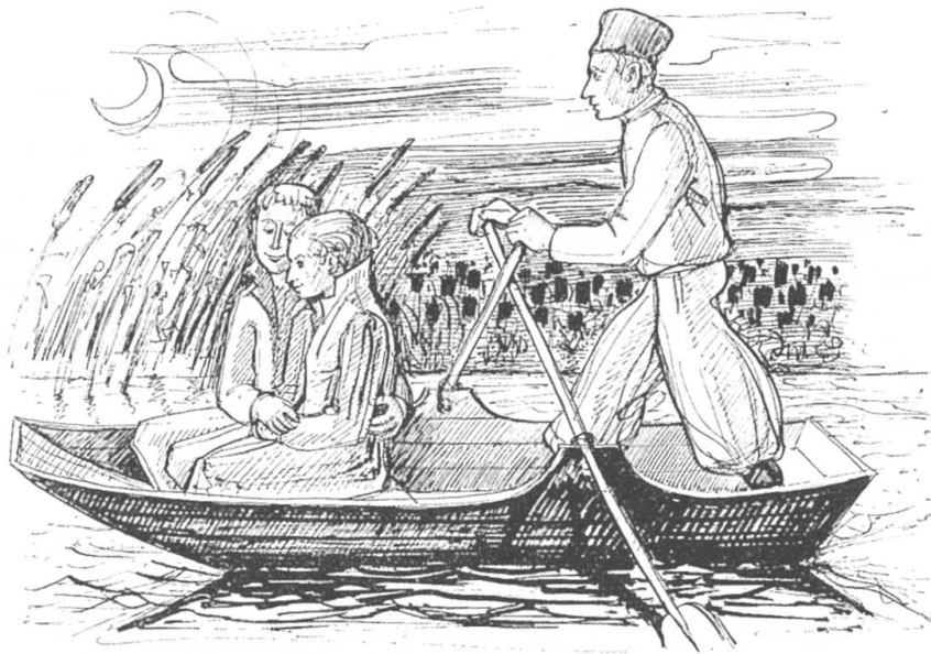
Sie fahren durch Blumen und Nacht in die Stille hinein.