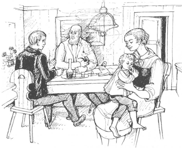
Walterli lacht mit tränenverschmiertem Gesicht.