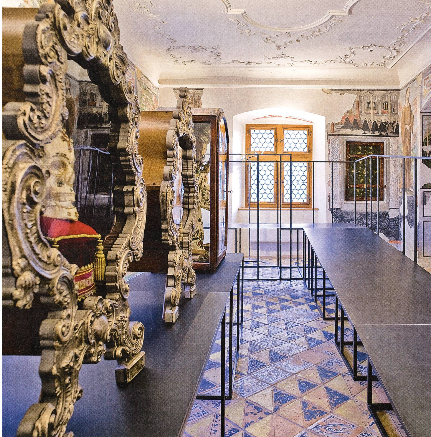
«Nachhall und Witterung», Klosterarbeiten. Winkelriedhaus, Stans, Sammlungspräsentation.