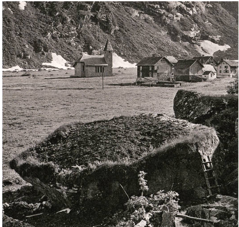
Kartoffelacker auf einem Findling. Göschenalp um 1930.

So, wie die Kartoffel im Alpenraum früher akzeptiert wurde als in grossen Teilen Europas, zeichnet sich die Ernährungsgeschichte Nidwaldens auch durch eine frühe Akzeptanz von weiteren Lebensmitteln aus, die man andernorts noch lange wenig schätzte. Dazu gehört unter anderem der Reis. Das hängt damit zusammen, dass Nidwalden früher noch als andere Innerschweizer Kantone den Getreideanbau im ausgehenden Mittelalter fast vollständig aufgab und sich auf die Milch- und Viehwirtschaft spezialisierte. Mit Rindern, Milchkühen und Käsen beliefert wurden