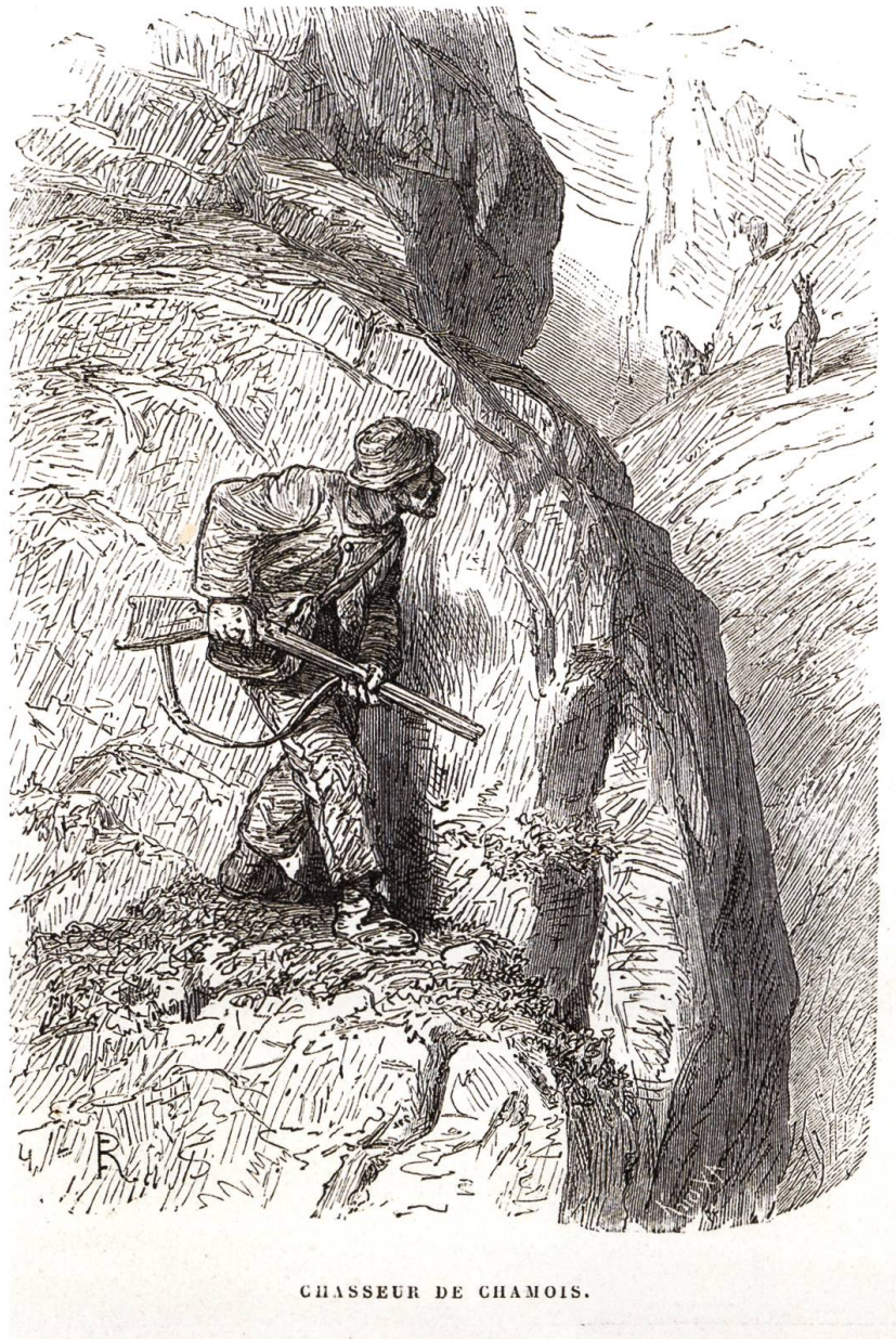
CHASSEUR DE CHAMOIS.

Innerschweizer Mostbirnen an: Theilersbirnen, Schweizer Wasserbirnen, Gelb- und Grünmöstler, Guntershauser oder Märxler Birnen. Birnen übrigens, die alle im Kanton Nidwalden heute noch vielerorts zu finden sind – auch wenn etwa die Grünmöstler an Beliebtheit verloren hat und viele Bäume gefällt wurden, da sie als Spätbirne erst gegen Ende Oktober oder Anfang November reif ist. Also zu einer Zeit, da die Bauern nach einer arbeitsreichen Erntezeit wenig Lust haben, Birnen gar aus dem Schnee zusammenzusammeln, für die sie heute kaum mehr Geld kriegen. Früher war das Sammeln der Spätfrüchte übrigens vor allem in grossen Familien Aufgabe der Kinder, wie heute noch die eine oder andere Nidwaldner Bäuerin erzählt.