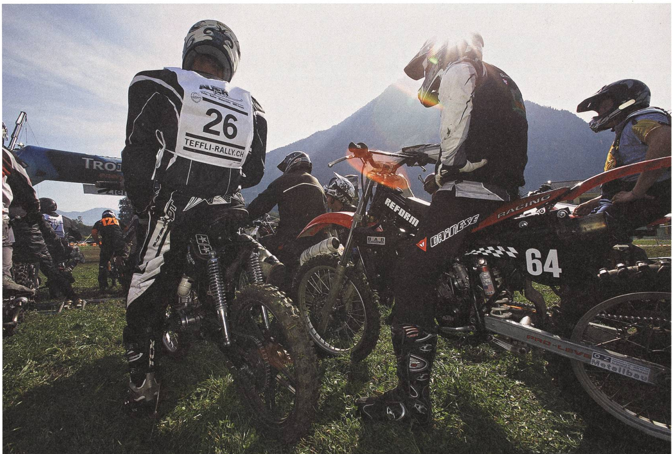
Aus 40 mach 160: Die Fahrerzahl stieg rasant aufs Limit von 160.