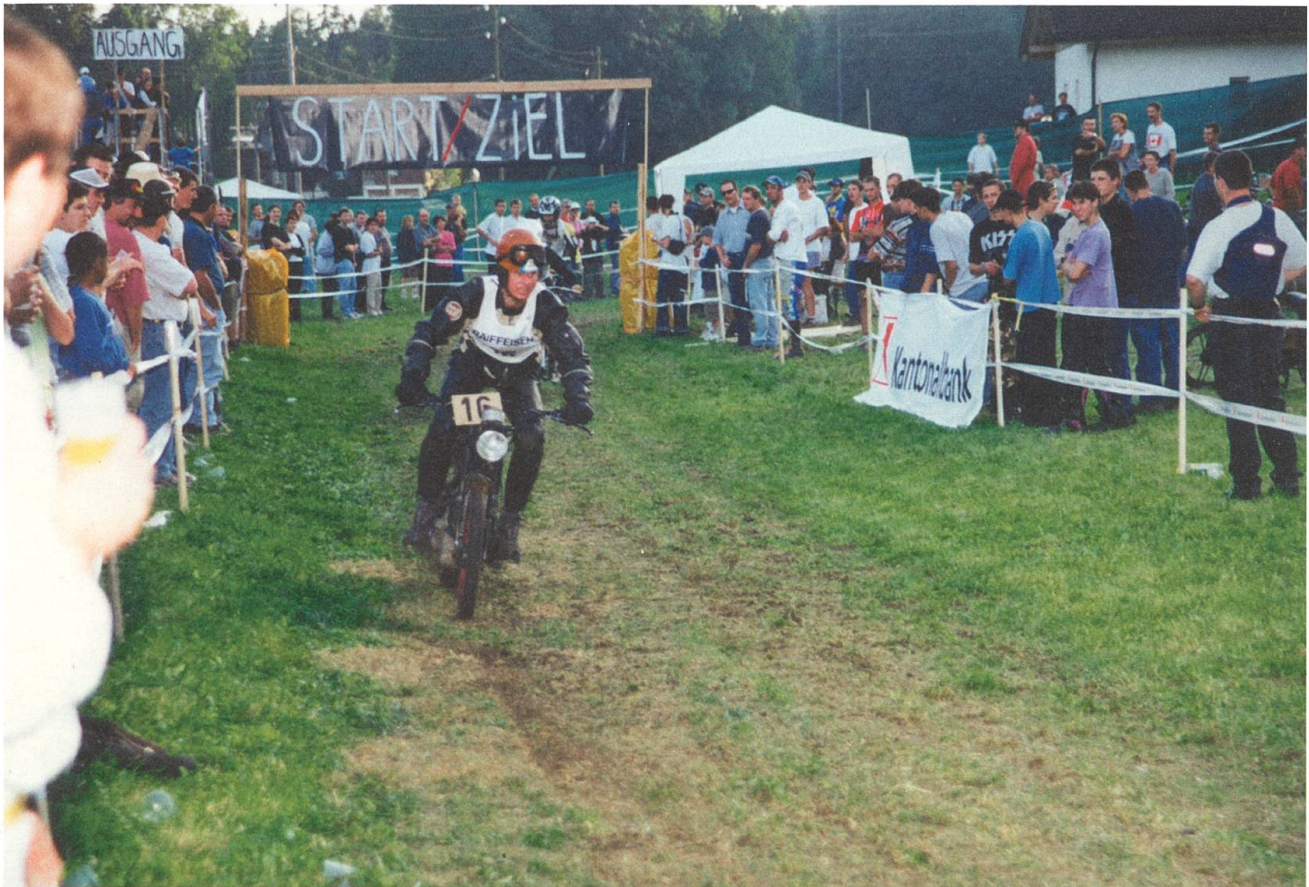
Verwirklichung einer Stammtischrunden-Idee: Die erste Rally im Jahr 2000 mit 1200 Zuschauern und 40 Fahrern.