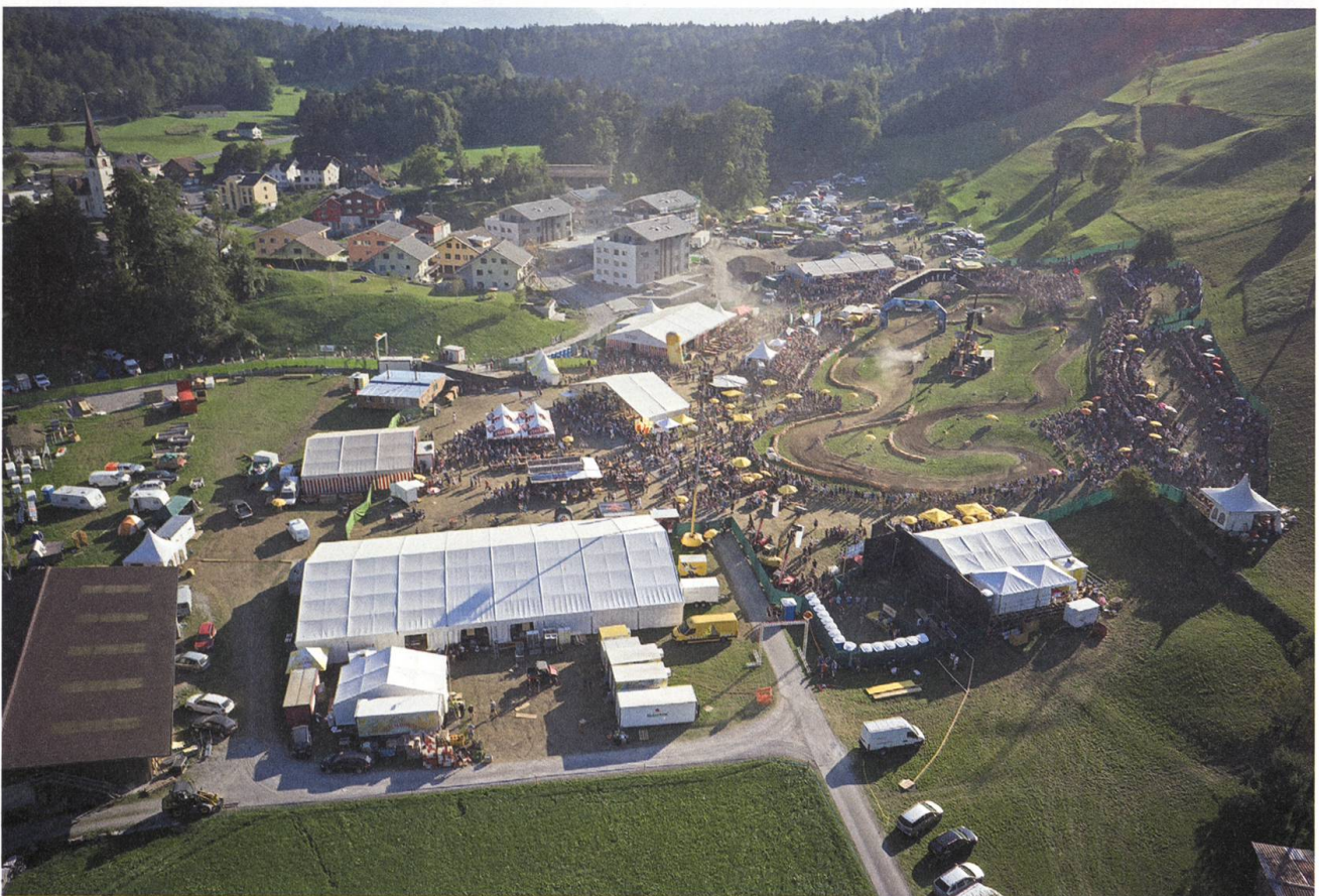
Die 9. Ausgabe im Jahr 2015 im ganzen Ausmass, inklusive Fahrer-Lager rechts hinten.