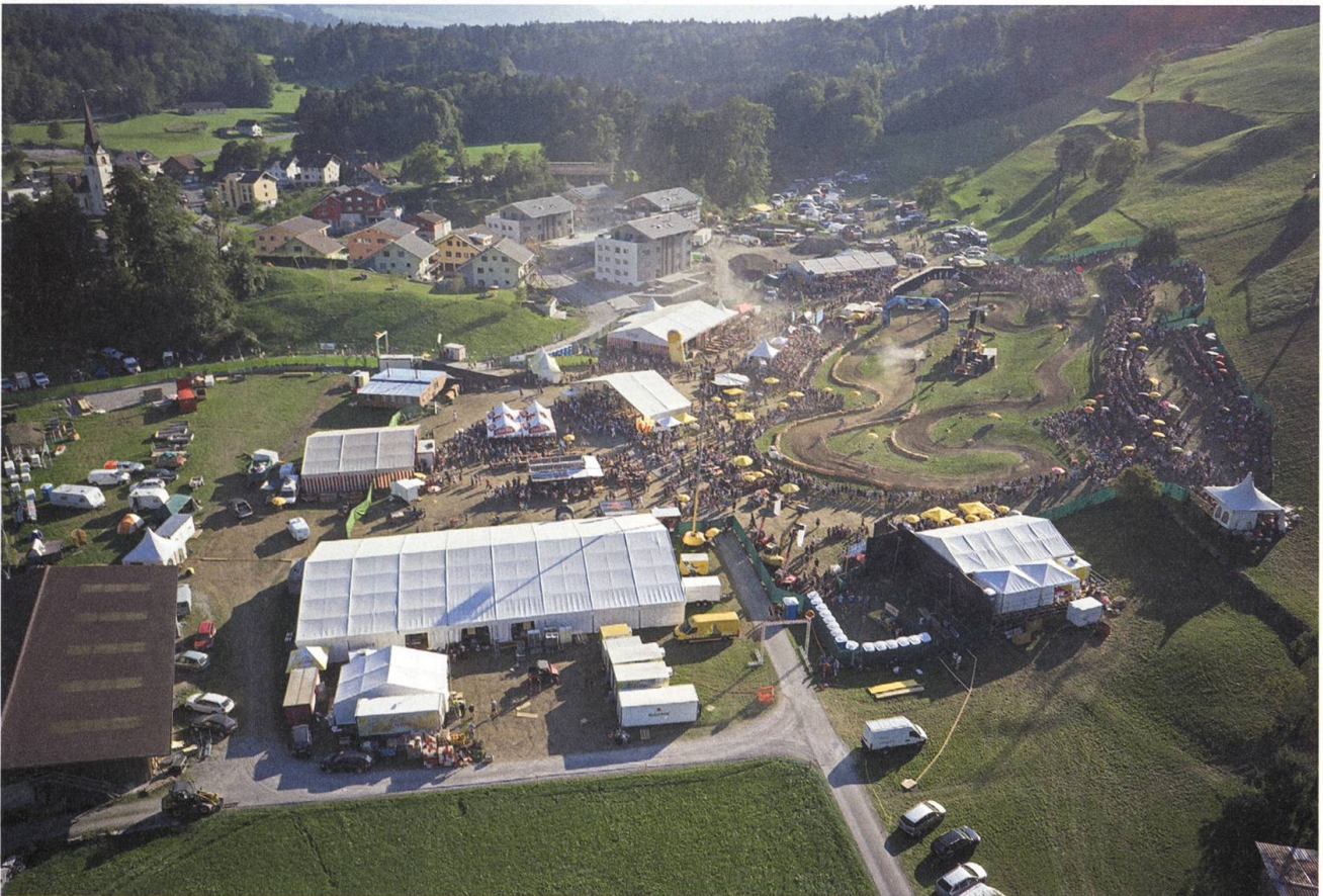
Die 9. Ausgabe im Jahr 2015 im ganzen Ausmass, inklusive Fahrer-Lager rechts hinten.