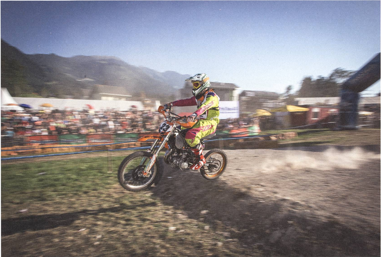
Drei Fahrer-Kategorien bieten den besonderen Unterhaltungswert: hier Kategorie 1.