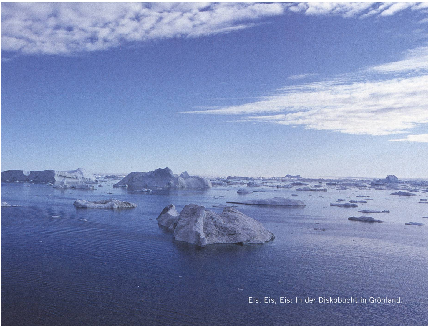
Eis, Eis, Eis: In der Diskobucht in Grönland.

In Grönland schien wenigstens die Sonne. Aber auf Spitzbergen wird schnell klar: Der Wind ist