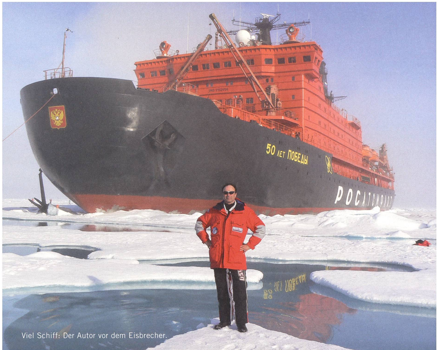
Viel Schiff: Der Autor vor dem Eisbrecher.

Der Eisbrecher nähert sich dem Höhepunkt. Alle Gäste auf Vorderdeck! Die Crew macht den Champagner bereit. Alle anderen ihre Fotoapparate und Flaggen. Ein Japaner drückt einem Kasachen ein iPad in die Hände, es zeigt 89,973 023 Grad Nord, alle schweigen aufgeregt. 89,972 730 – wir sind am Punkt vorbeigefahren. Neuer Anlauf. 89,989 324. Es ist 21.49 Uhr mitteleuropäische Zeit. 90,000 000! Das Schiffshorn bläst, die Passagiere jubeln, die Crew verteilt Champagner, Umarmungen, Küsse, Gratulationen, «we have reached the North Pole», ruft der Expeditionsleiter aus den Lautsprechern, der Captain hat Präzisionsarbeit geleistet. Und ich möchte rausgehen, vom Schiff hechten, mich auf dem Eis wälzen, das Eis unter den Füßen spüren, nicht das Schiff. Aber das geht nicht. Das Eis ist zu dünn. Vor vier Monaten