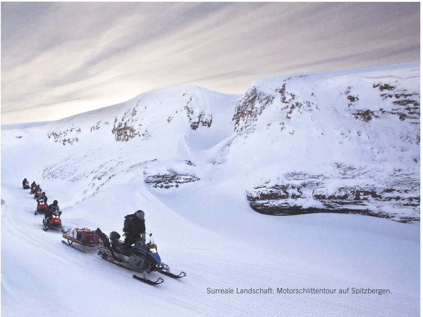
Surreale Landschaft: Motorschlittentour auf Spitzbergen.

Eine halbe Stunde später ist das Inferno vorbei, der Kahn legt ab, und tschüss, gottlob. Zurück