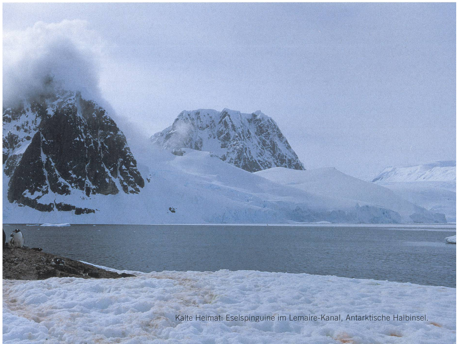
Kalte Heimat: Eselspinguine im Lemaire-Kanal, Antarktische Halbinsel.

Allerdings erst Jahrhunderte später, am 16. Februar 1820: Da sah der deutschstämmige russische Seefahrer Fabian von Bellingshausen als erster Mensch das sagenumwobene Land, die Terra australis incognita, mit eigenen Augen. Ein Jahr später setzte der amerikanische Robbenjäger John Davis als erster Mensch seinen Fuss auf das neue Festland, so geht jedenfalls die inoffizielle Kunde, gesichert ist das Erstbetreten durch den