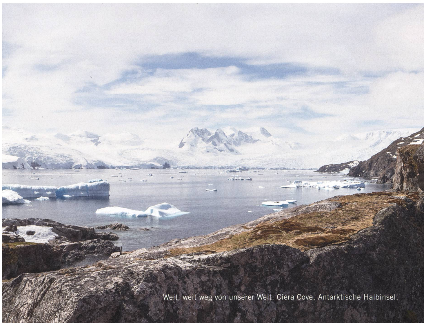
Weit, weit weg von unserer Welt: Ciera Cove, Antarktische Halbinsel.

Ja, man könnte durchaus ein bisschen spirituell werden angesichts dieser für unseren Verstand nicht fassbaren Wildnis. Meine zweite Reise in die Antarktis begreife ich deshalb durchaus als