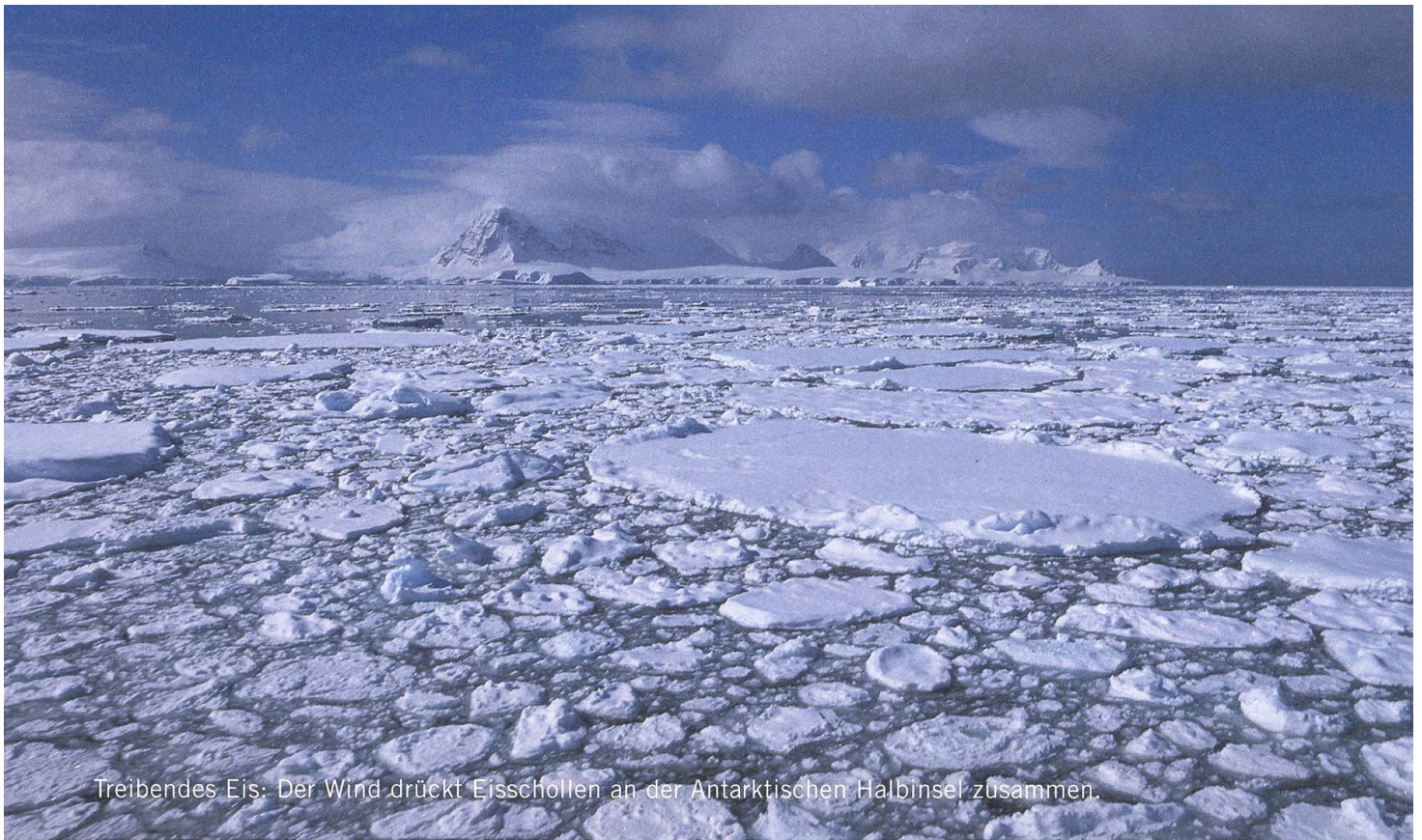
Treibendes Eis: Der Wind drückt Eisschollen an der Antarktischen Halbinsel zusammen.

norwegischen Naturforscher Carsten Egeberg Borchgrevink. Auf alle Fälle traten die beiden einen regelrechten Run auf die Antarktis und ihren Südpol los. Bis dann aber wirklich jemand am südlichsten Punkt des südlichen Kontinents ankam, dauerte es noch einmal fast hundert Jahre. Es war der Norweger Roald Amundsen, am 14. Dezember 1911.