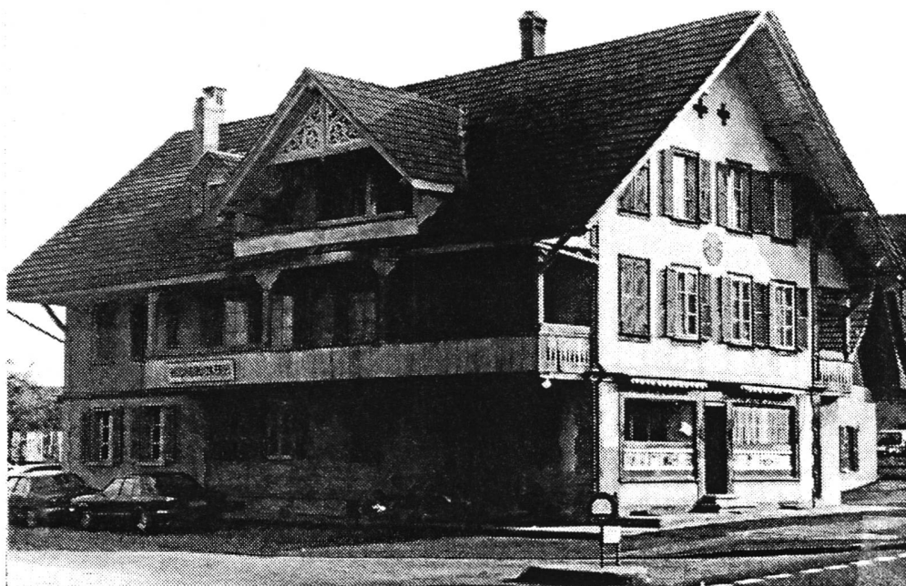
"Altes Konsum", Dorfstrasse, Uetendorf

Pour sauvegarder ce bâtiment, le groupe "Kulturzunft Dorflüt" a obtenu que les parties en cause, soit la commune (propriétaire) et le Gürbetalbahn (acheteuse potentielle), d'attendre encore deux ans avant de décider sans appel de la démolition de cette maison dans le quartier de la gare, ce afin d'éviter de créer une situation de fait incontournable.