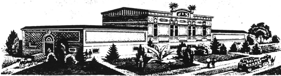
Les caves Malaga de Lenzbourg, 1889-1986.

- Les caves Malaga de Lenzbourg ont été démolies.