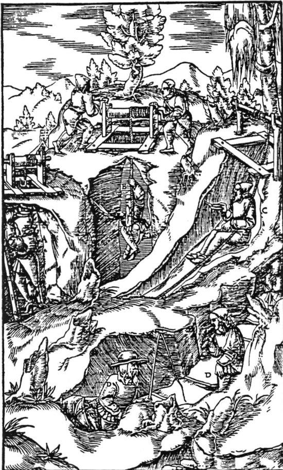
Einfahrende Bergleute (Aus "Bergwerk Herznach")