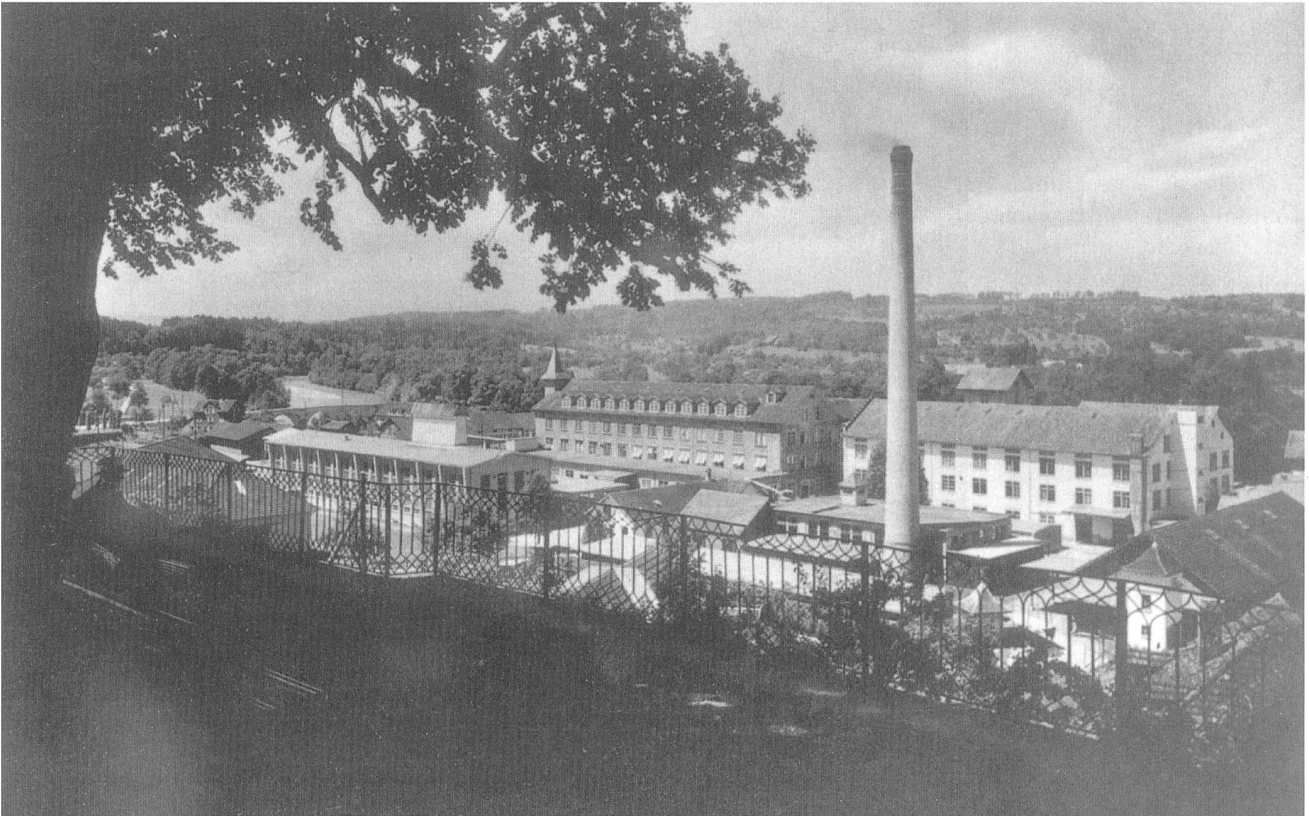
Die Papierfabrik Bischofszell

lagen und der umfangreichen Wasserkraftanlagen aus den Jahren 1918 bis 1938. Als überregional einzigartig wurde die Papiermaschine der Firma J. M. Voith in Heidenheim taxiert.