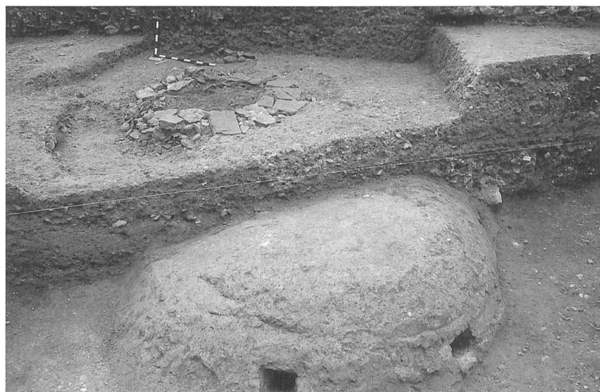
Das neu entdeckte Römergewölbe von oben: Die halbkugelige Kuppel überwölbt einen 4 Meter hohen Hohlraum, der intakt erhalten ist

Jürg Rychener Römerstadt Augusta Raurica Giebenacherstrasse 17 4302 Augst