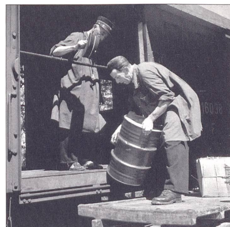
Im Zeitalter der Grosscontainer wirkt dieses Zeitdokument bereits sehr historisch: Stückgut- verlad bei den SBB anfangs der 1960er-Jahre.

Schlagzeilen vom Niedergang oder der Internationalisierung vieler schweizerischer Industriebetriebe haben das Ende des 20. Jahrhunderts geprägt. Davon nicht verschont blieb auch die Rollmaterialindustrie, wo Traditionsfirmen wie die Schweizerische Lokomotiv- und Maschinenfabrik SLM in Winterthur oder die Schweizerische Industrie-Gesellschaft SIG in Neuhausen – um nur zwei Beispiele zu nennen – in grossen internationalen Industriekonglomeraten aufgingen. Die traditionellen Bundesbetriebe SBB und PTT wurden neu strukturiert, und bereits früher hatten die letzten Betriebe der Schweizer Nutzfahrzeugindustrie ihre Eigenständigkeit aufgegeben.