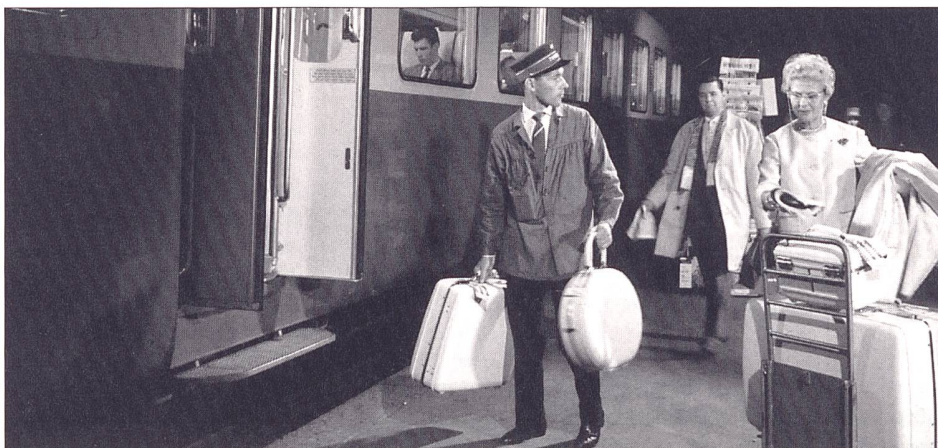
Internationales Reisen mit Stil: Zur Lancierung des elektrischen Trans-Europ-Express RAe TEE II, der unter vier Stromsystemen verkehren konnte, produzierten die SBB 1961 eine Serie von Werbeaufnahmen. Die Dame rechts im Bild ist die Schweizer Schauspielerin Anne-Marie Blanc.

nisch-Brötli-Bahn bis zu den ersten Vertretern der heutigen Lokomotivtypen – die Infothek beim Bahnhof Bern. Die Infothek, deren Wurzeln bis zur Gründung der SBB-Bibliothek 1923 reichen, unterhält eine Verkehrsbibliothek mit 25 000 Bänden und das historische Archiv der SBB sowie Bild- und Film- resp. Videosammlungen. Das audiovisuelle Archiv mit über 250 000 Bildern, über 1000 Plakatsujets und mehreren hundert Filmen und Videos stellt einen repräsentativen Querschnitt durch die ersten hundert Jahre der SBB, aber auch generell über das 20. Jahrhundert als ein Jahrhundert des Verkehrs dar.