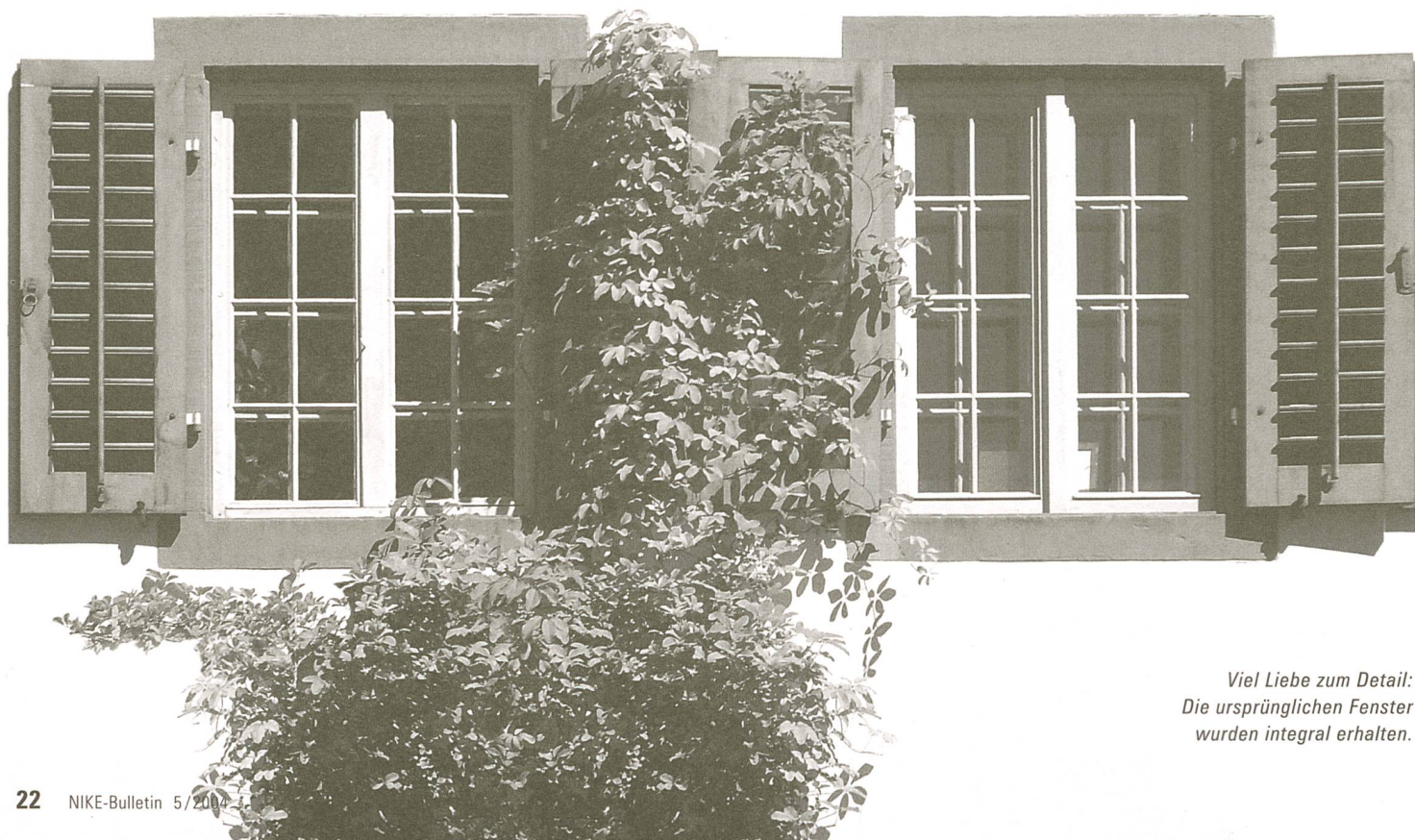
Viel Liebe zum Detail: Die ursprünglichen Fenster wurden integral erhalten.