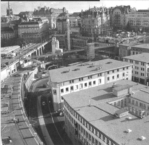
Le vallon du Flon: vue vers l'est.

Le Flon , ruisseau qui prend sa source au Bois des Liaises dans le Jorat, traverse les communes du Mont, d'Epalinges et de Lausanne. Reçoit plusieurs affluents dont la Louve, bute contre la moraine Bourg-Chavannes, oblique à l'Ouest et part se jeter dans le Léman près de la Maladière. Il peut se muer en torrent déchaîné, comme en 1555, et par trois fois durant le XIXe siècle. Sur ses berges, intra-muros et hors les murs s'implantent des moulins dès le Moyen Âge. Le mitan du XIXe siècle voit d'établir, en aval du Grand Pont (1869–1875) une scierie, des meuneries et boulangeries et une chocolaterie. Le Flon, égout collecteur, est canalisé dès 1836 à hauteur de la Porte Saint-Martin et de 1869 et 1875 dans le secteur rue Centrale, Pépinet et Grand Pont. Alors qu'en 1874 s'achève l'enfouissement de l'arcature inférieure du Grand Pont, en 1900, le voûtage du Flon, suivant scrupuleusement les méandres du cours d'eau, atteint pratiquement l'emplacement du futur Pont Chauderon-Montbenon (1904–1905).