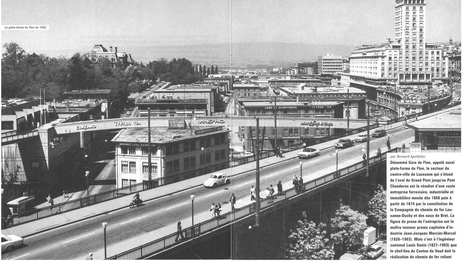
La plate-forme du Flon en 1950.

par Bernard Apothéloz Dénoté Gare du Flon, appelé aussi plate-forme du Flon, le secteur du centre-ville de Lausanne qui s'étend de l'aval du Grand Pont jusqu'au Pont Chauderon est le résultat d'une vaste entreprise ferroviaire, industrielle et immobilière menée dès 1868 puis à partir de 1874 par la constitution de la Compagnie du chemin de fer Lausanne-Ouchy et des eaux de Bret. La figure de proue de l'entreprise est le maître tanneur promu capitaine d'industrie Jean-Jacques Mercier-Marcel (1826-1903). Mais c'est à l'ingénieur cantonal Louis Gonin (1827-1903) que le chef-lieu du Canton de Vaud doit la réalisation du chemin de fer reliant Lausanne à Ouchy, aujourd'hui métro L-O. Ses voies, à écartement normal, permettent le convoyage des wagons en provenance du réseau international. L'inauguration de la ligne Lausanne-Ouchy a eu lieu le 16 mars 1877.