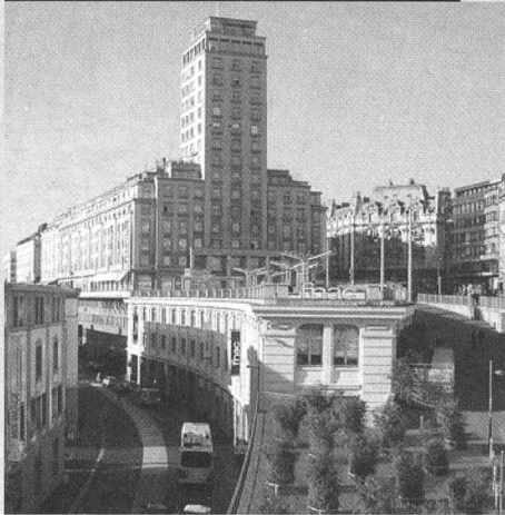
Le bâtiment de l'ancienne Gare aux marchandises de Bel-Air construit en 1901.