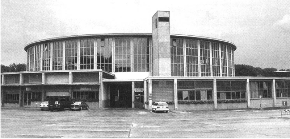
Der Armee-Motorfahrzeugpark in Grolley – ein Anfang der 1970er-Jahre entstandener Bau.

(1917), das «Werkstattgebäude mit Grossflugzeughalle» (1922) oder das Aufnahme- und Empfangsgebäude (1931).