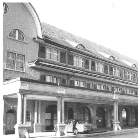
Das 1919 errichtete Kantonale Zeughaus in Herisau, Südfassade.

den einzelnen Nutzungen zugeordneten Pavillonbauten standen am Anfang der Entwicklung hin zu den modernen Waffenplätzen. Doch erst in den Jahren 1959–1964 wurde in Bremgarten (AG) der erste moderne Waffenplatz realisiert.