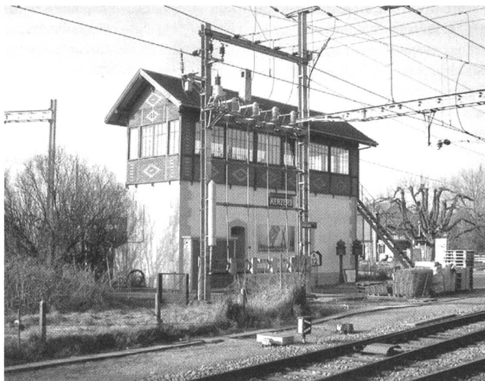
Das historische Stellwerk in Kerzers bleibt auch nach dem Bahnhofumbau erhalten.

Im Jahr 2000 verfasste der Architekt Christian Hanus seine Diplom-