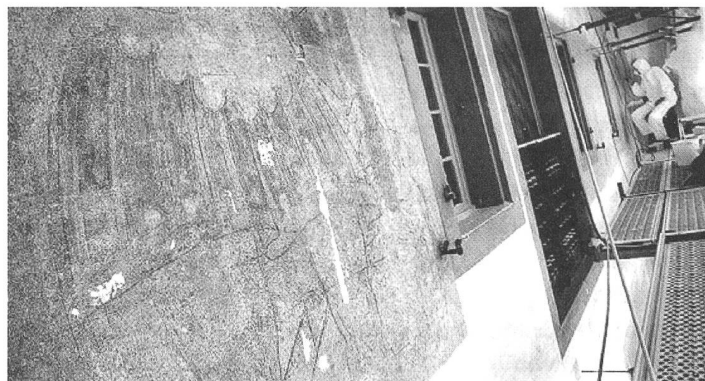
Schloss Büren an der Aare: Im oberen Bereich der Fassade konnte eine detailreiche Malerei wiedergewonnen werden.