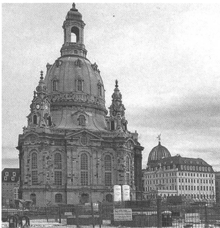
Sonderfall oder Paradigma? Die wiederaufgebaute Dresdner Frauenkirche.

Wie sich ein Bauwerk nicht ohne Verlust an Erkenntnispotenzialen auf sein Bild reduzieren lässt, sind die emotionalen Werte nicht auf den ästhetischen Schau- und Erlebniswert einer schnelllebigen Eventkultur einzugrenzen. Angesprochen sind grundsätzliche Fragen des Daseins, wenn heute über Identität in der multikulturellen Gesellschaft, über Erinnerung, über Erfahrungen beschleunigter Entwicklung etc. diskutiert wird. Dabei kann es nicht um heile Welten und schönen Schein, um die Glättung von Brüchen oder allein um Kompensation ge-