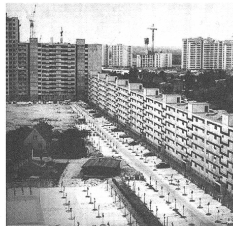
Einprägsame, aber wenig differenzierte Gegenüberstellung im Katalog der Deutschen Wanderausstellung zum Denkmalschutzjahr: «Zweimal Planung (1666 und 1966): Handwerkliches Bauen und Industrielle Produktion, menschengerecht oder maschinengerecht?»

Schon 1975 haben sich einige Denkmalpfleger Gedanken zur Schutzwürdigkeit der Bauten des 20. Jahrhunderts gemacht. Albert Knoepfli beispielsweise forderte in seiner Abschlussbilanz zum Denkmalschutzjahr, angesichts des rasanten Wandels des Baubestandes sei nicht nur das Urgrossväterliche, sondern auch das Grossväterliche, ja das väterliche Architekturerbe zu schützen. Solche Überlegungen standen aber nie im publizitätsträchtigen Zentrum der damaligen Aktivitäten und blieben im Wesentlichen auf Fachdiskussionen beschränkt. Da-