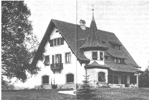
Villa Gardy à Malagnou, près de Genève, œuvre d'Edmond Fatio.