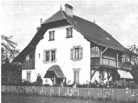
Villa Chabloz à l'Ermitage, près de Genève, par Baudin & Camoletti.