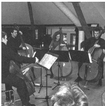
Après l'Assemblée ordinaire de l'Association de soutien au Centre NIKE, les délégués ont pu écouter un divertissement musical proposé par le Quatuor Pro Basso (4 contrebassistes).

La Présidente a informé les personnes présentes des affaires courantes et des tâches principales menées à bien par le secrétariat au cours de l'exercice. La Présidente démissionnaire a profité de l'occasion pour souligner, dans son introduction, les problèmes actuels et urgents dans le domaine de la protection de la culture.