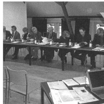
Die 16. ordentliche Delegiertenversammlung fand am 25. März 2004 in der Hochschule der Künste in Bern statt.