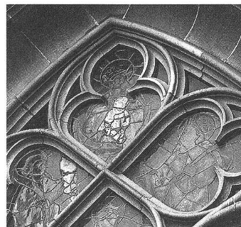
Berner Münster. Masswerkfenster, um 1450. Die Schutzverglasung von 1947 beschränkt sich auf die unteren Teile der Fenster, die Masswerke sind von angegriffenen Glasoberflächen gezeichnet.