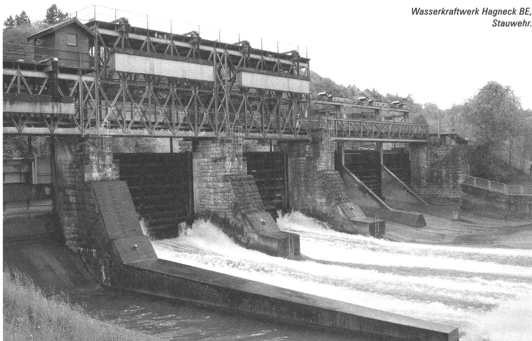
Wasserkraftwerk Hagneck BE, Stauwehr.

Die Gesamtkommission versammelte sich sechsmal zu einer ganztägigen Sitzung, die in der Regel mit Besichtigung und Diskussion eines aktuellen denkmalpflegerischen Problems verbunden war. In diesem Zusammenhang entstanden schriftliche Stellungnahmen zur neuen Infrastruktur und den Arbeitsabläufen im Expertcenter für Denkmalpflege in Zürich (ZH) sowie zur Erneuerung des Dachs der Klosterkirche in Münstair (GR).