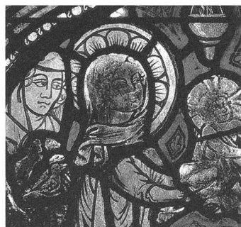
Hauterive (FR), Klosterkirche. Durch Oxydationen im Glas («Verbräunungen») entstellte Glasmalereien des frühen 14. Jahrhunderts.

4.2.1 Für die Sicherheit der Glasmalereien während ihrer Untersuchung und Behandlung am Ort muss ein geeigneter Zugang geschaffen werden.