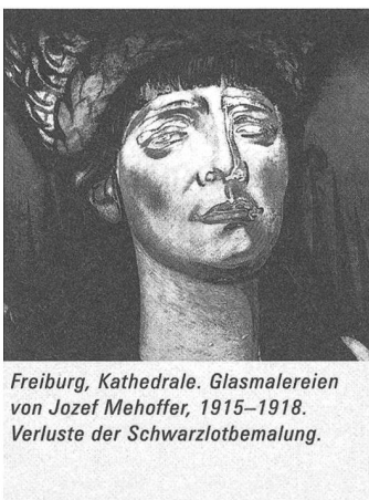
Freiburg, Kathedrale. Glasmalereien von Jozef Mehoffer, 1915–1918. Verluste der Schwarzlotbemalung.

Auskünfte: Schweizerisches Zentrum für Forschung und Information zur Glasmalerei Romont, Au Château, CP 225, 1680 Romont, T 026 652 18 34, vitrail@bluewin.ch