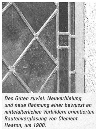
Des Guten zuviel. Neuverbleiung und neue Rahmung einer bewusst an mittelalterlichen Vorbildern orientierten Rautenverglasung von Clement Heaton, um 1900.