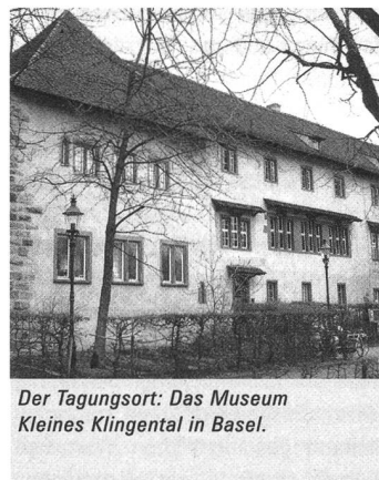
Der Tagungsort: Das Museum Kleines Klingental in Basel.