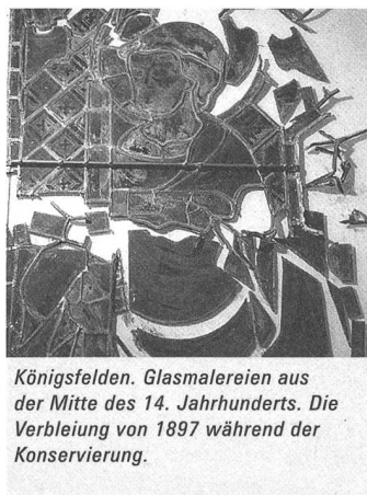
Königsfelden. Glasmalereien aus der Mitte des 14. Jahrhunderts. Die Verbleiung von 1897 während der Konservierung.