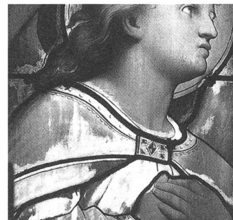
Basel, Elisabethenkirche. Glasmalerei von C. H. Burkhardt, 1865. Schäden der Email-Bemalungen durch Kondensfeuchte.