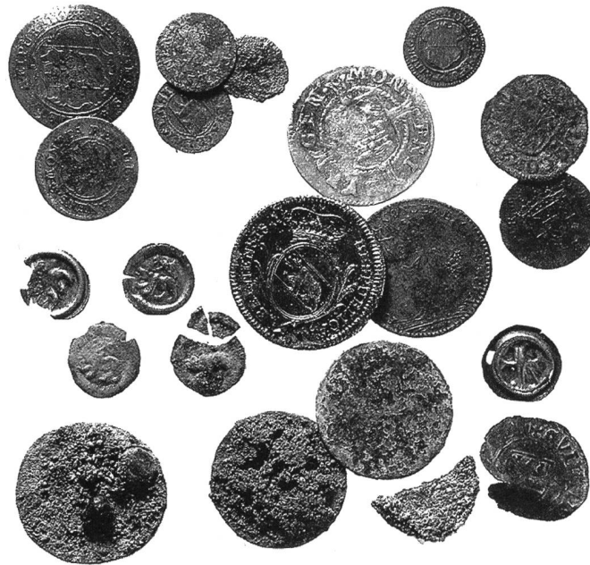
Bern, Waisenhausplatz: Auswahl aus ca. 170 Fundmünzen, die bei den Ausgrabungen 2001/2002 zum Vorschein kamen.

Mit der Gründung des Inventars der Fundmünzen der Schweiz IFS, das seit 1992 die Fundmünzenbearbeitung auf nationaler Ebene koordiniert, eröffnete sich der SAF der Weg, ihre Tätigkeit vermehrt auf den wissenschaftlichen Informationsaustausch und auf spezifische Fragestellungen zu konzentrieren. Die jährlichen Kolloquien der SAF beleuchten umfassende Problemkreise oder enger begrenzte Themen. 1993, 1995, 2000, 2002 und 2005 führte die SAF internationale Tagungen durch. Die wissenschaftlichen Ergebnisse dieser Kolloquien wurden publiziert (vgl. unten und die Rezensionen in der Rubrik «Publikationen»).