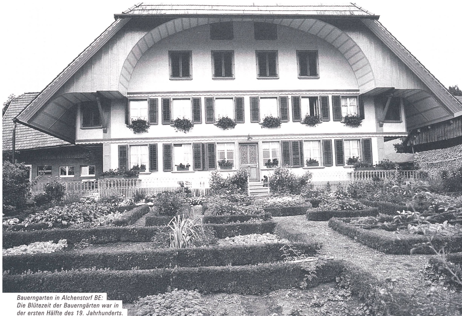
Bauerngarten in Alchenstorf BE: Die Blütezeit der Bauerngärten war in der ersten Hälfte des 19. Jahrhunderts.

Sie dienten ihnen als Vorbilder für ihre eigenen Landsitze in der Schweiz.