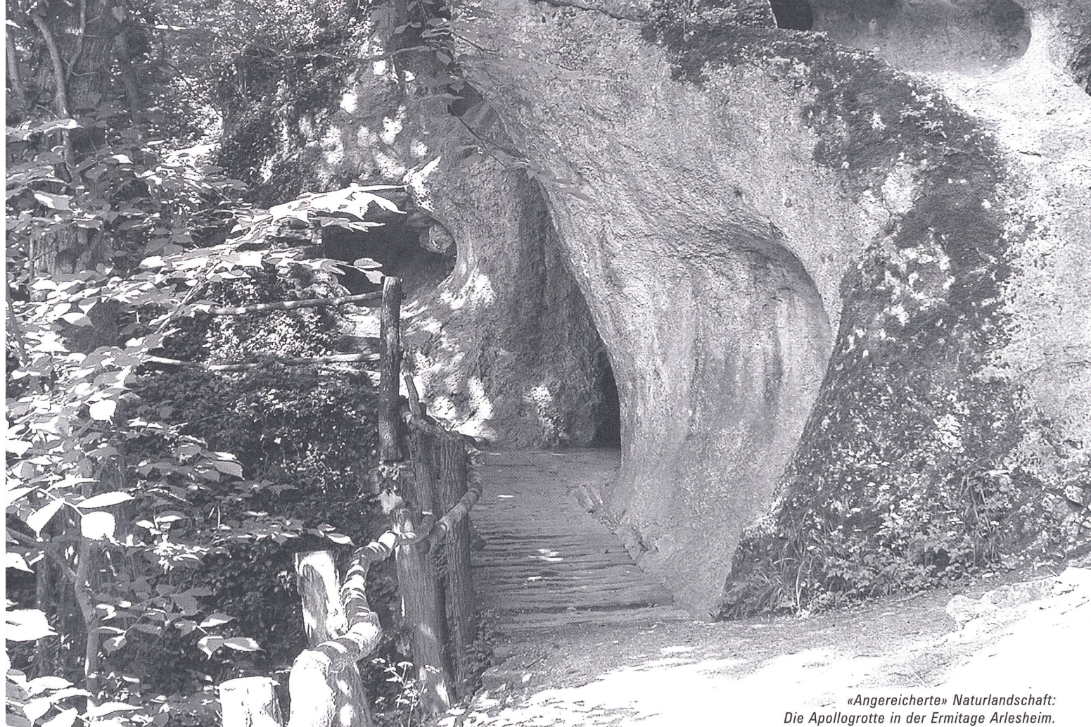
«Angereicherte» Naturlandschaft: Die Apollogrotte in der Ermitage Arlesheim.