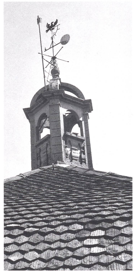
Klosterkirche Einsiedeln: Detailansicht mit Dach und Laterne.

nungen mit dem gebauten Erbe. Damit diese Erfahrung auch in Zukunft noch möglich sein wird, müssen wir uns unermüdlich dafür einsetzen, dass alte Ziegeldächer erhalten und unterhalten werden.