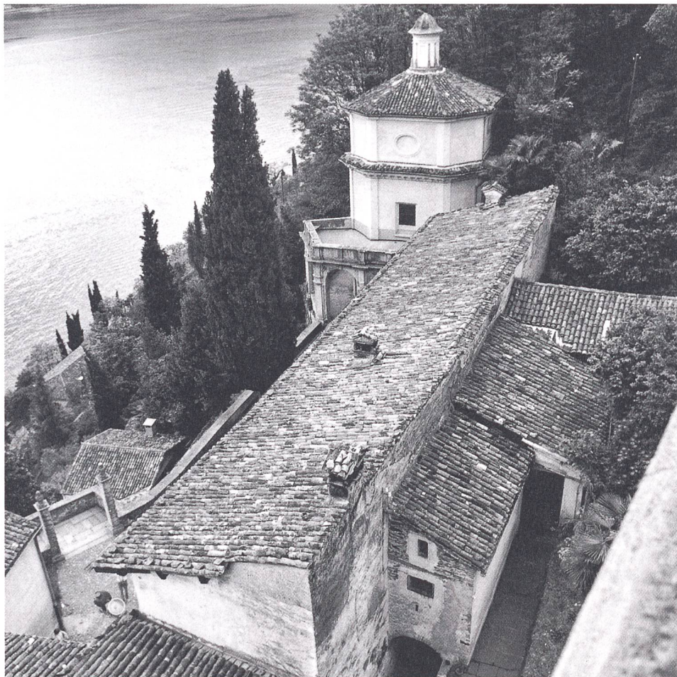
Blick auf die Dächer der Kirche Madonna del Sasso in Morcote.