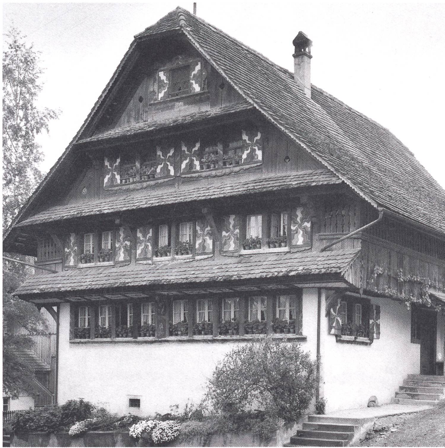
Das 1791 erbaute Koch-Haus in Büttikon AG: Zweigeschossiger Ständerbau mit dreifachen Klebedächern und steilem Krüppelwalmdach.

Bei Fragen hinsichtlich der Erhaltungsfähigkeit eines historischen Ziegelbestandes kann beim Bundesamt für Kultur BAK um die Ernennung eines Bundesexperten für Ziegel er-sucht werden. Diese Dienstleitung ist im Sinne einer Zweitmeinung insbesondere dann nützlich, wenn der mit den Arbeiten betraute Dachdecker entgegen den Absichten der Denkmalpflege den Ziegelbestand aufgrund seines Zustandes ersetzen will.