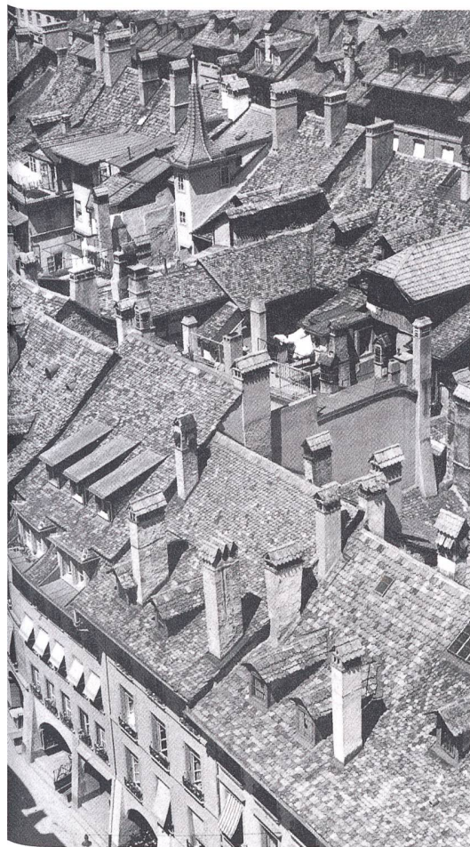
Dächerlandschaft in der St. Galler Altstadt. Im Hintergrund: Die Türme der Kathedrale.