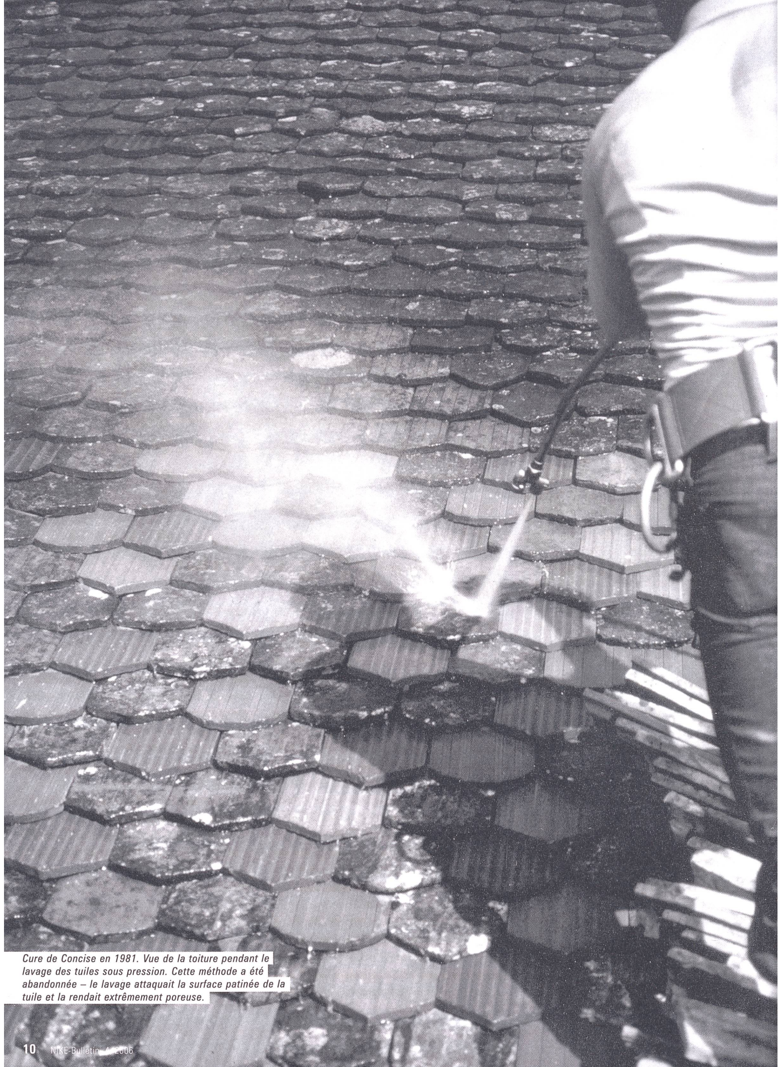
Cure de Concise en 1981. Vue de la toiture pendant le lavage des tuiles sous pression. Cette méthode a été abandonnée – le lavage attaquait la surface patinée de la tuile et la rendait extrêmement poreuse.