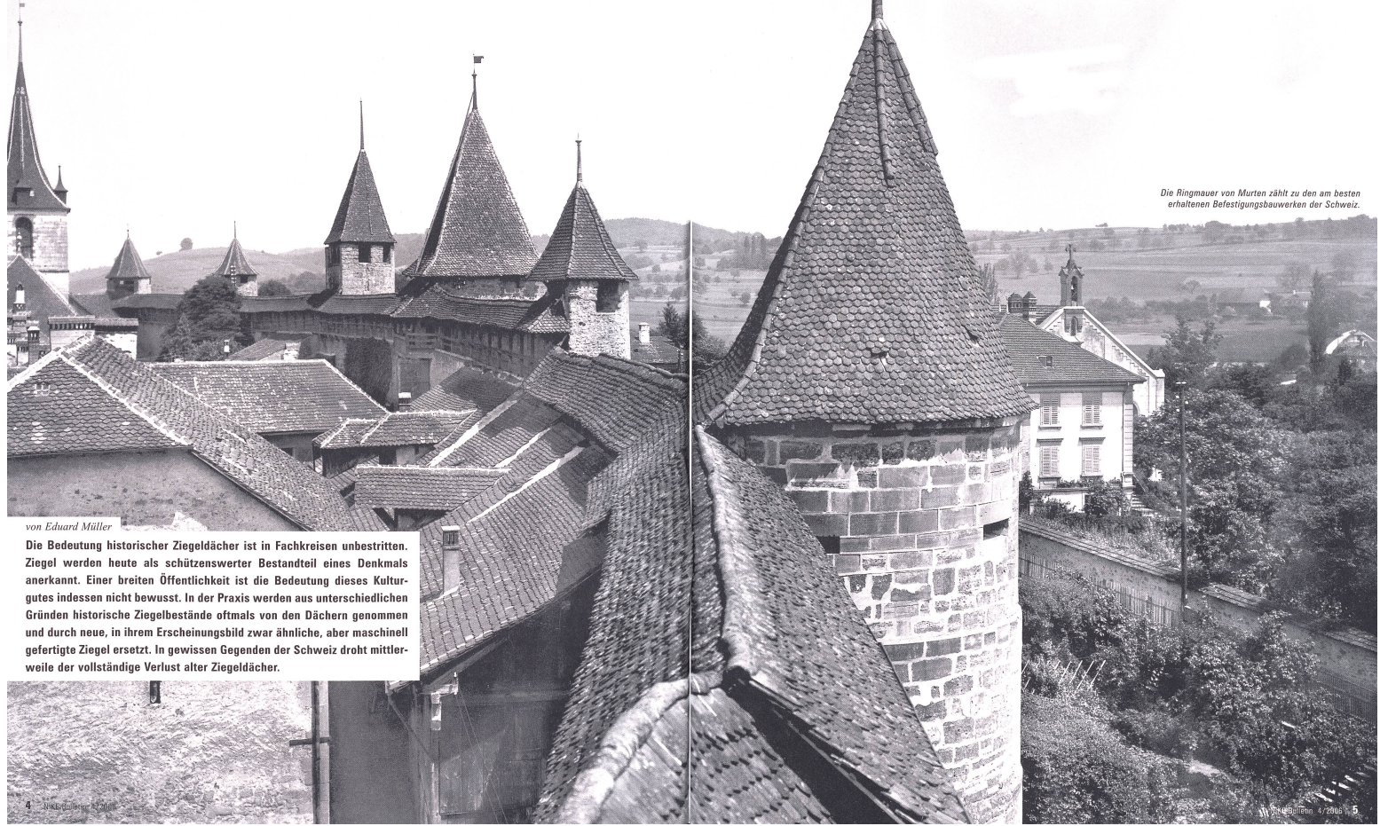
Die Ringmuer von Murten zählt zu den am besten erhaltenen Befestigungsbauwerken der Schweiz.

Erkenntnisse der VSD-Arbeitsgruppe «Ziegel» zum Umgang mit einem wenig beachteten Kulturgut