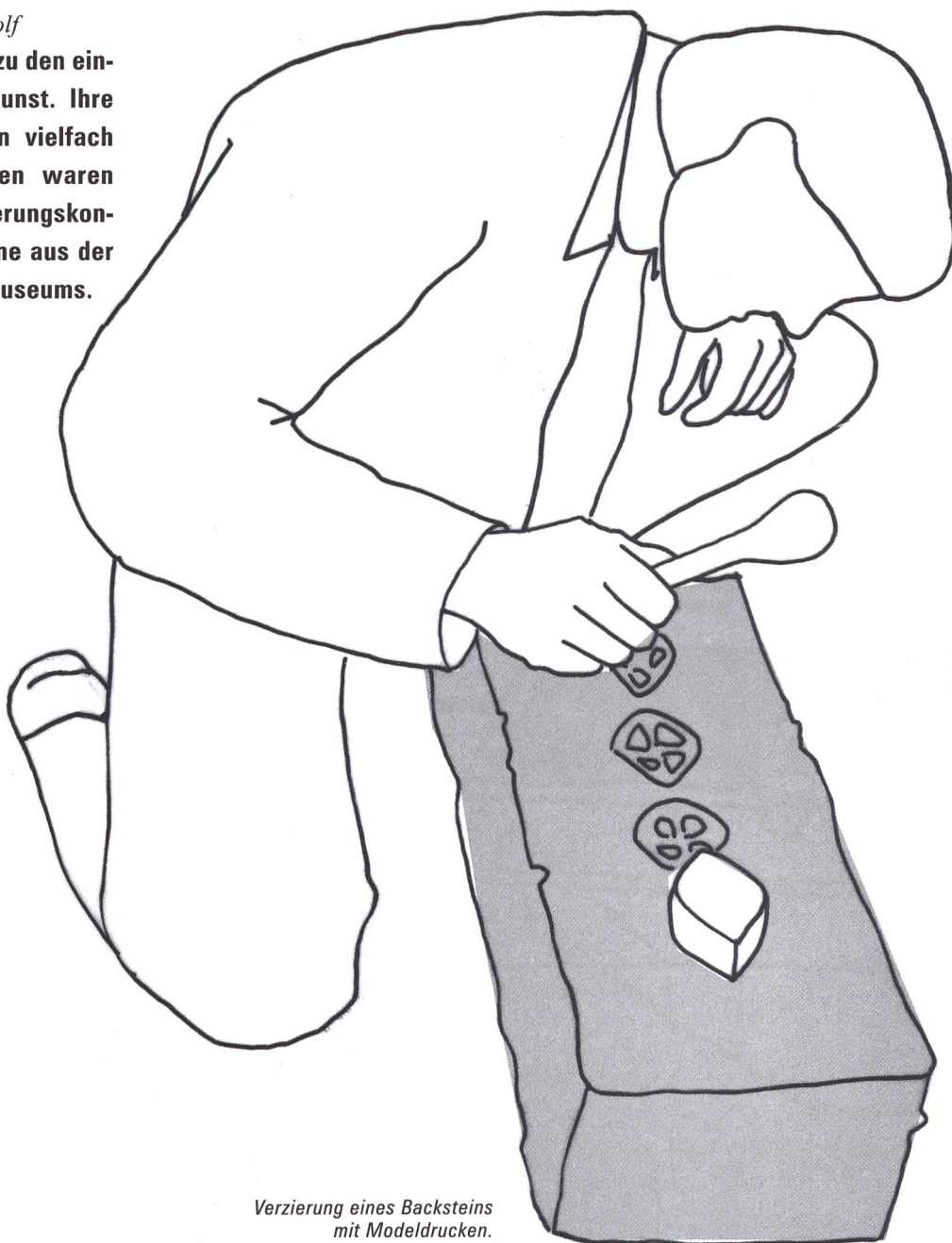
Verzierung eines Backsteins mit Modelldrucken.

Die Backsteine von St. Urban LU gehören zu den eindrucklichsten Beispielen der Backsteinkunst. Ihre Geschichte und ihre Herstellung wurden vielfach untersucht. Interdisziplinäre Forschungen waren Grundlage für ein umfassendes Konservierungskonzept für einige stark gefährdete Backsteine aus der Sammlung des Schweizerischen Landesmuseums.