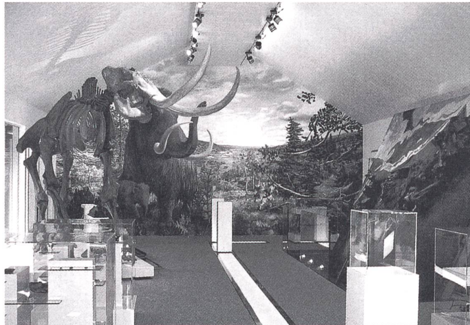
Nun besitzt auch die Schweiz ein Mammutmuseum.

Das neu eröffnete Museum gewährt einen Einblick in die eiszeitlichen Funde von Niederweningen und zeigt ein eindrückliches Panoramabild des Wehntals vor 45 000 Jahren. Die zahlreichen bebilderten Informationstafeln führen die Besuchenden auf dem «Zeitpfad» von der Gegenwart und Besiedlung in geschichtlicher Zeit zur Pflanzen- und