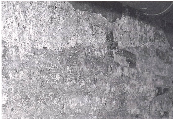
Burgdorf, Wehrturm, unterhalb des Daches, wenig abgenutzte ehemalige Sichtbackstein-Partie.

Die drei genannten Bauten, Wehrturm oder Bergfried, Wohnturm oder Palas und Halle sind über einem Natursteinsockel aus Backstein aufgeführt worden. Dabei diente der künstlich hergestellte Mauerstein nur zur Bildung der Aussen- und Innenschale, während der Mauer Kern aus einem Gemisch aus Mörtel und Kiesel, unter Verwendung einzelner Sandstein- und Tuffbrocken, besteht. Es handelt sich um die ersten Backsteinbauten, die nach dem Untergang des Römerreichs in der Schweiz entstanden sind. Die Backsteinproduktion wurde im Laufe des 13. Jahrhunderts dann von Zisterzienserabteien (St. Urban, Fraubrunnen, Friesenberg) übernommen. Seit den Untersuchungen der 1970er-Jahre ist be-