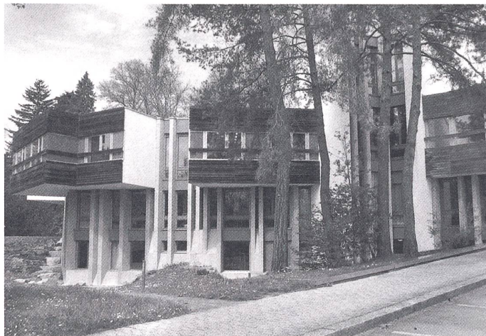
Das vom Architekturbüro Guhl, Lechner und Philipp realisierte Konservatorium (1965).

Insgesamt wurden 2188 Gebäude überprüft, die in den bisherigen Listen – Inventar 1981 und Ergän-