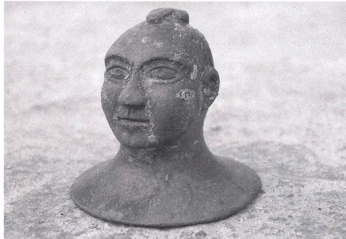
Seltener Fund: Büste eines kahlhäuptigen Mannes mit einem Phallus auf dem Kopf.

Den bemerkenswertesten Fund bildet zweifellos die nur rund 5,2 Zentimeter hohe Bronzebüste des glatzköpfigen Mannes. Auffallend an ihr sind nicht nur die Gesichtsform und der kahle Schädel mit dem Haarbüschel am Hinterkopf, sondern vor allem das erigierte Glied auf dem Schädel. In der Schweiz sind bislang nur drei vergleichbare Büsten gefunden worden – alle jedoch ohne Phallus. Der Phallus galt in römischer Zeit auch als Glücksbringer, der Unheil abwenden sollte. Deshalb zierte dieses Symbol Alltagsgegenstände, Häuser und Strassen. Die Dietiker Bronzebüste war vermutlich auf dem Holzjoch eines Wagens angebracht.