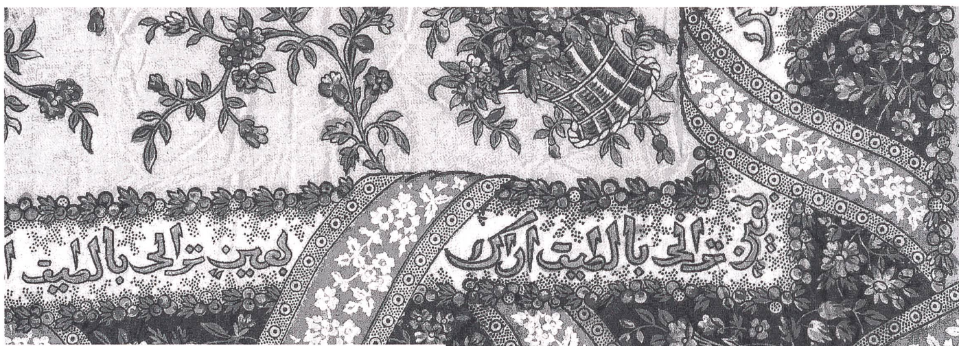
Eines der sehr vielen Batikmuster aus der Mustersammlung der Firma Blumer, die am Fabrikationsstandort Schwanden am Zusammenfluss der Sernft und Linth 170 Jahre lang industriell tätig war.

Unternehmensarchive – ein Kulturgut? Beiträge zur Arbeitstagung Unternehmensarchive und Unternehmensgeschichte, hrsg. vom Schweizerischen Wirtschaftsarchiv und vom Verein Schweizerischer Archivarinnen und Archivare, Baden, hier + jetzt Verlag, September 2006, Fr. 29.80.