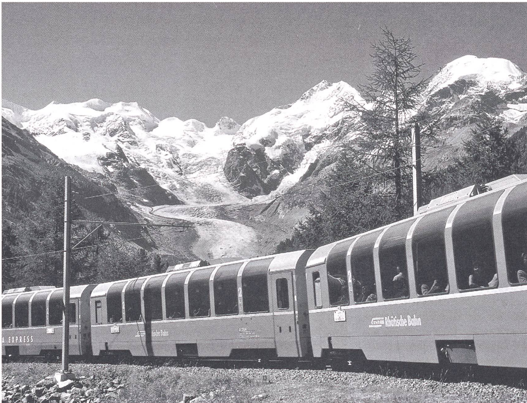
Beim Bau der Albula- und Bernina-Bahn ist speziell darauf geachtet worden, dass die Reisenden die Landschaft besonders gut wahrnehmen können.