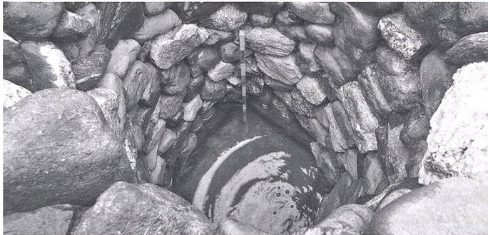
Archäologische Überraschung: Der in Oberwinterthur freigelegte Brunnen.