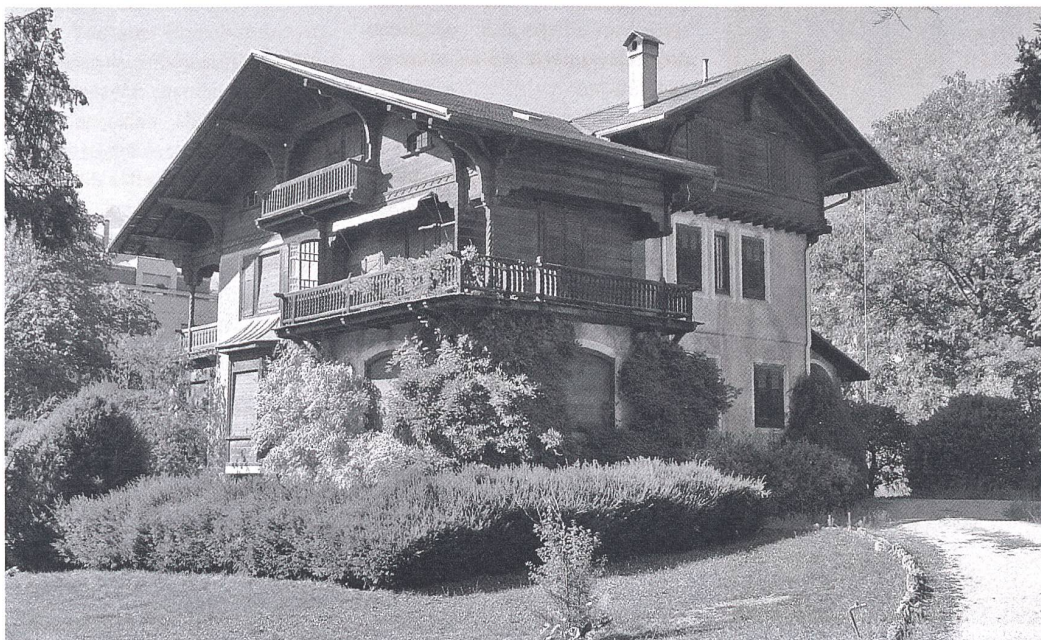
L'imposant chalet «Heimatstil» situé au Chemin des Collines 16 à Sion.

Renaud Bucher, Conservateur cantonal des monuments de l'Etat du Valais