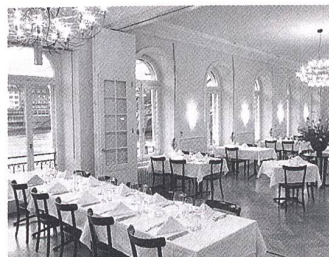
Der rheinseitig gelegene, helle Speisesaal mit Blick auf Grossbasel.