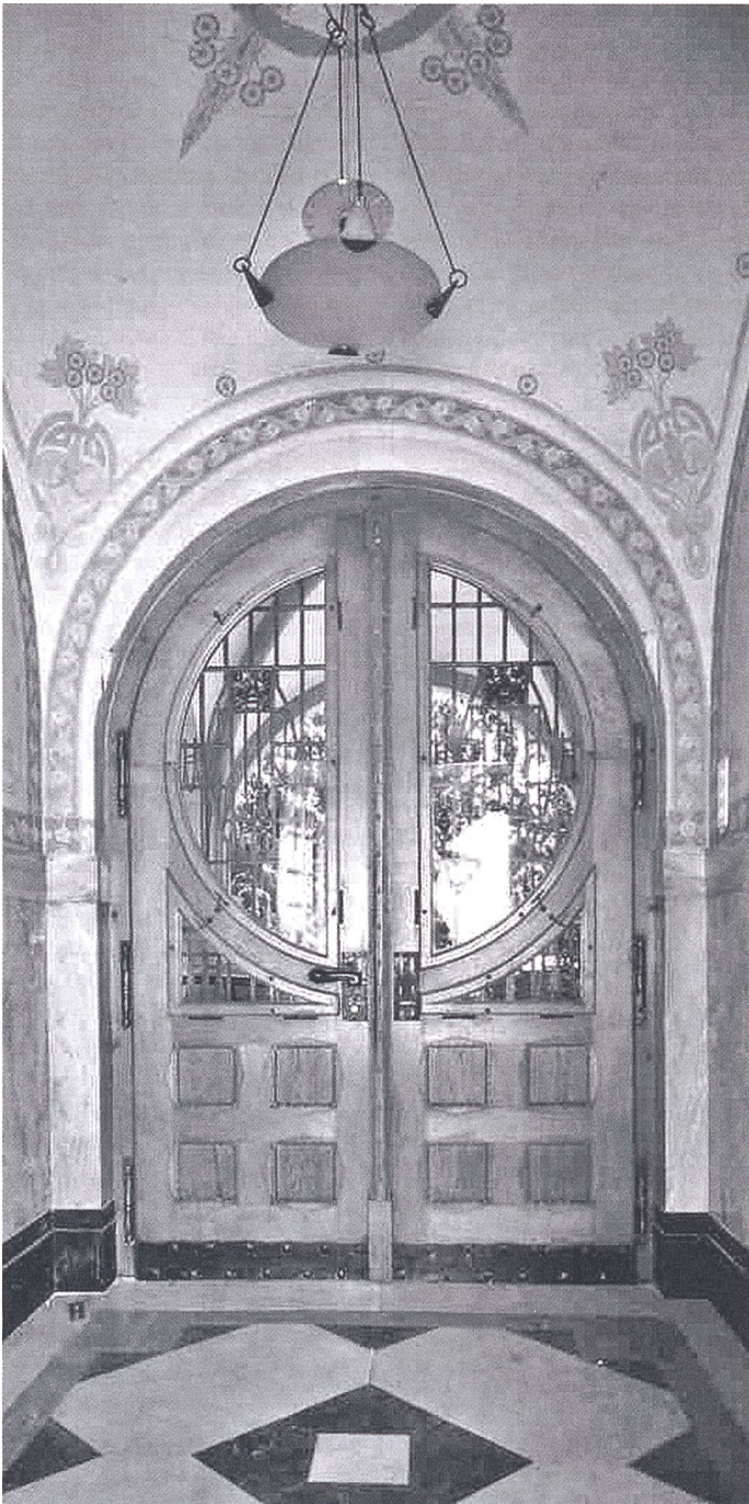
Die Villa Alma in Männedorf zählt zu den wichtigsten Zeugen der Neugotik im Kanton Zürich.