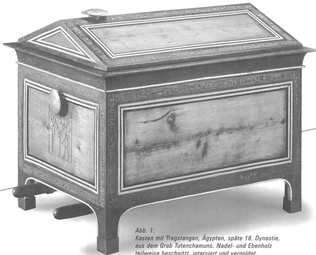
Abb. 1: Kasten mit Tragstangen, Ägypten, späte 18. Dynastie, aus dem Grab Tutenchamuns. Nadel- und Ebenholz teilweise beschnitzt, intarsiiert und vergoldet, Elfenbein, Blattgold, Kupferlegierung, Glaspaste.

Eine reiche Handwerkstradition mit Aussichten