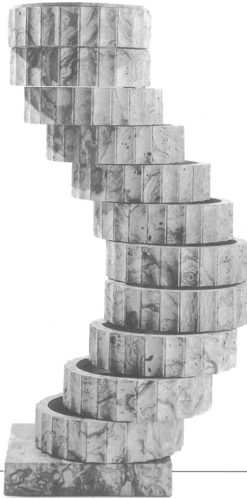
Abb. 7: «Lehrstück II: Störung der Form durch die Funktion», Schubladen- stock, Robert & Trix Haussmann, 1978. Olivenesche furniert.