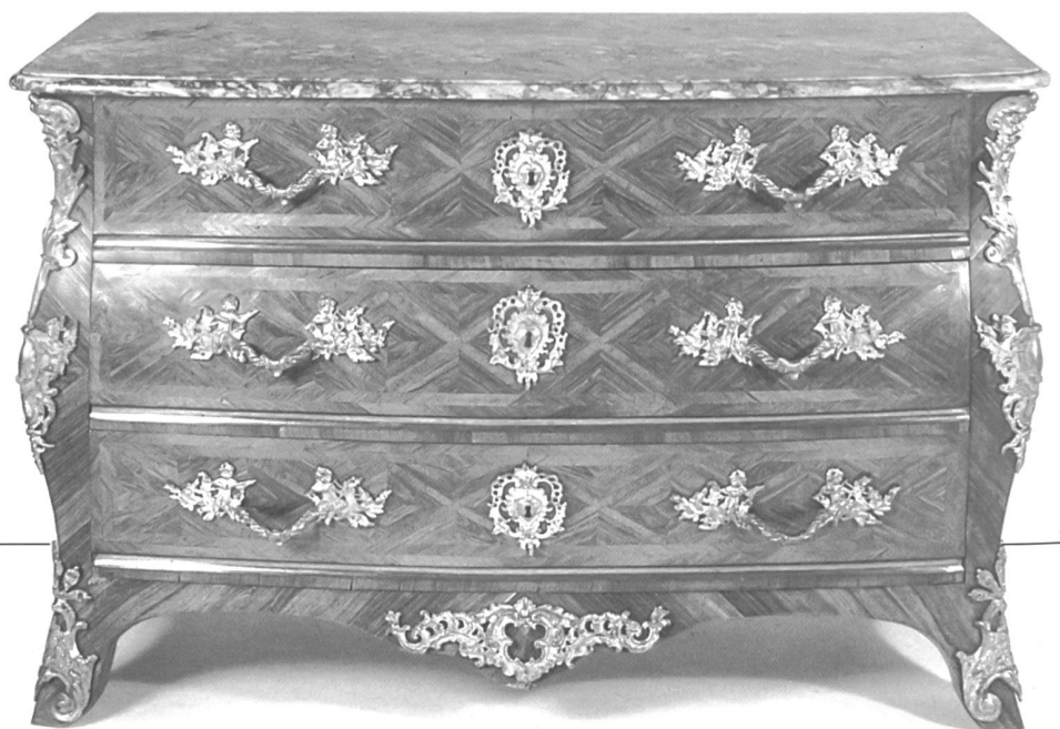
Abb. 3: Prunkkommode, Bern, Mathäus Funk, um 1740. Aussenhaut Palisander und Nussbaummaser auf Nadelholz, feuervergoldete Bronzebeschläge, Deckplatte aus «Marbre de Belp», Schubladen mit Kleisterpapier.

Nördlich der Alpen und damit auch in der Schweiz zierten in der Renaissance überreich gestaltete Marketerie-Gemälde aus einheimischen Harthölzern (Abb. 2), im Früh- und Hochbarock vorgeblendete Architekturordnungen die dahinter befindlichen nüchternen Möbelkuben. Ab dem Spätbarock und bis in das Spätbiedermeier hinein wurden die anspruchsvolleren Kastenmöbel vorwiegend mit ausgesuchten einheimischen Edel-