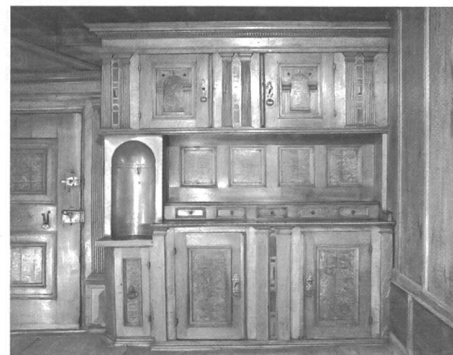
So präsentiert sich das Renaissance-Buffet in der Götzenstube nach der Restaurierung.