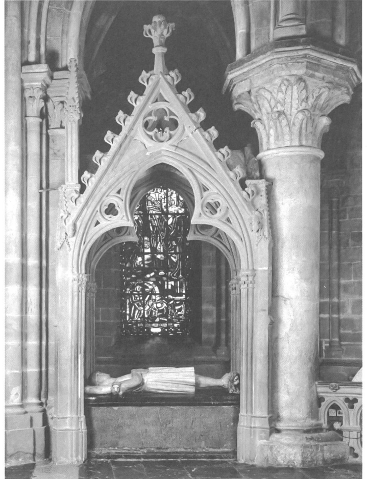
Monument d'Othon de Grandson († 1328), face sud.

Bien que les autorités bernoises aient interdit les inhumations dans les temples (1529), cette pratique reprend dès la fin du XVI e siècle. A Lausanne, les premiers monuments d'après la Réforme datent des années 1630; ils sont d'abord très simples (dalles) et ne donnent que le nom du défunt, sa fonction et ses armoiries. Un premier édicule adossé à la paroi apparaît en 1652, érigé pour Barbara Widenbach, belle-mère du bailli de Lausanne. Cette mode du monument «debout» ira en parallèle avec celle, plus traditionnelle, de la dalle au sol qui persiste jusqu'à la fin du XVIII e siècle. Elle donne à la cathédrale de beaux ouvrages d'esprit baroque, voire rococo, fréquemment traités dans du marbre noir de Saint-Triphon. Une série a pu être attribuée au sculpteur d'origine parisienne Louis Dupuis, actif à Lausanne dans les années 1750–1760; avec lui apparaissent des motifs iconographiques évoquant soit la mort et le passage du temps (crânes, tibias, cadrans d'horloge), soit la carrière des défunts: le monument de Samuel Constant de Rebecque (1756) est caractéristique à cet égard, portant tout un attirail militaire (tambours, drapeaux, canons) rappelant la brillante carrière de cet officier au service de la Hollande et mort au champ de bataille. Le monument