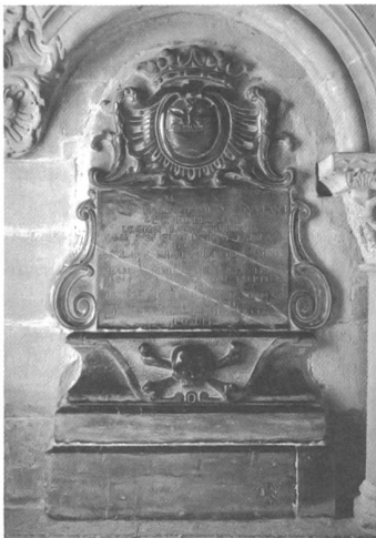
Stèle funéraire de Philippe-Germain de Constant († 1756), œuvre probable de Louis Dupuis.

Le monument d'Othon de Grandson († 1328) se distingue du lot, de par la personnalité du défunt et de par ses qualités architectoniques et stylistiques, révélant des influences françaises et anglaises; cette construction hors sol, démonstration de puissance, anticipe en quelque sorte d'une cinquantaine d'année deux monuments caractéristiques de la politique funéraire de la haute noblesse (La Sarraz, Neuchâtel).