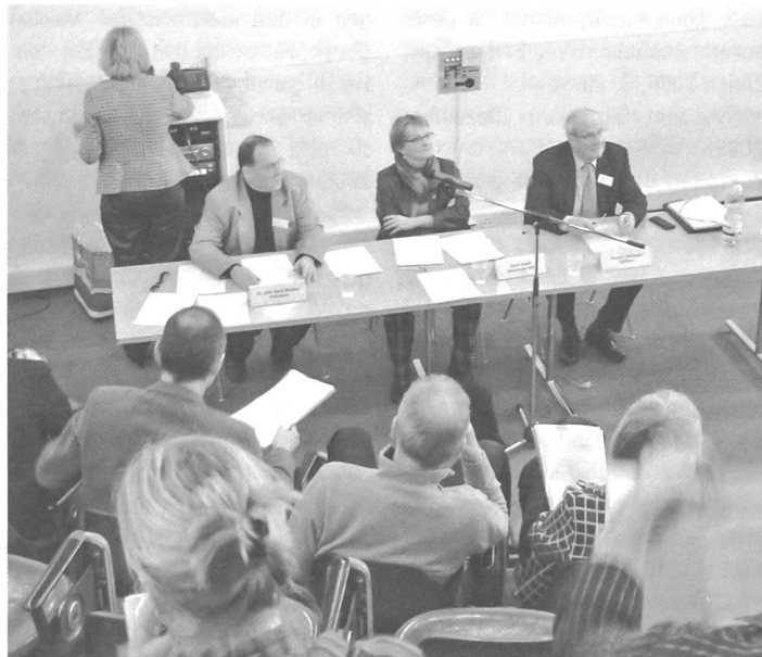
Die 18. ordentliche Delegiertenversammlung fand am 16. März 2006 im Vortragsaal der Stadt- und Universitätsbibliothek Bern statt.

«Europäischer Tag des Denkmals/ Journées européennes du patrimoine/ Giornate europee del Patrimonio» Offizielle gesamtschweizerische Broschüre zum Denkmaltag unter dem diesjährigen Slogan «Gartenräume – Gartenträume/Les jardins, cultures et poésie/Giardini tra sogno e realtà» vom 9./10. September 2006, gemischt dreisprachig deutsch, französisch und italienisch, Bern 2006, 84 S., ill., Auflage 63 000 Exemplare.