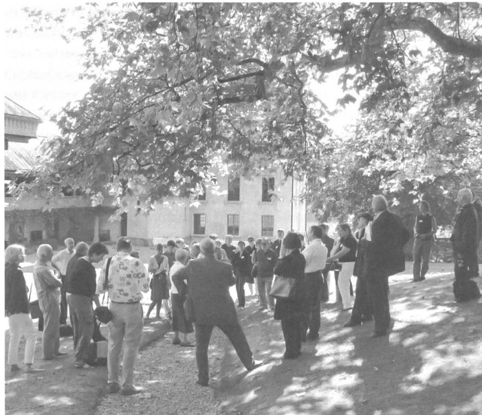
Ein rundum gelungener Anlass: Die Lancierung des Denkmaltages im Schlosspark von Barberêche.

Die Vorbereitungen liefen ab dem Frühjahr. Mit Lignum, dem Verband der Schweizer Schreinermeister und Möbelfabrikanten VSSM und dem Bund Schweizer Architekten BSA